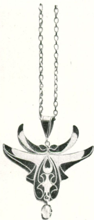
NÁSFA ZOMÁNCOS ÖTVÖSMUNKA

technikáit. Zománcos s drágaköves magyar stíli ékszereik külföldön ma is nagy keresletnek örvendenek. De ebből a múltba való visszatérésből nem kerekedett új fejlődés. Régi magyar stíli