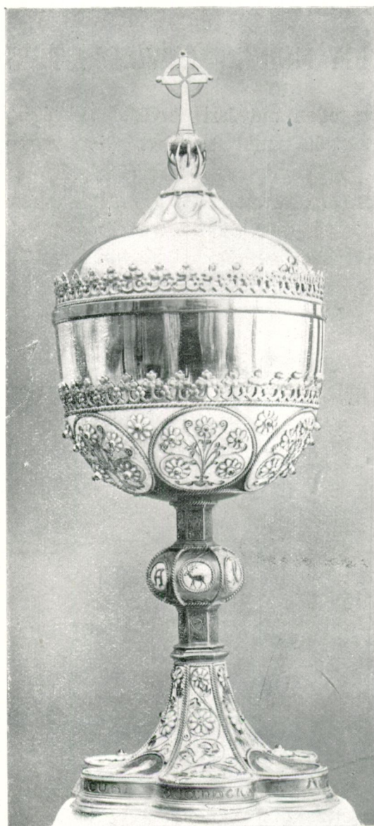
TARJÁN OSZKÁR MŰVEI