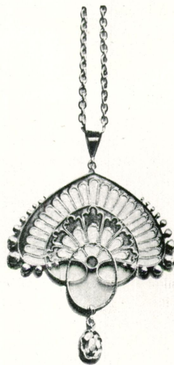
NÁSFA ZOMÁNCOS ÖTVÖSMUNKA

□ Ipolyi Arnold püspök, a finom izlésü régiségkutató és író búzgólkodására a múlt század hetvenes-nyolcvanas éveiben, néhány fővárosi aranyműves ismét fölkarolja az ötvösség régi magyar