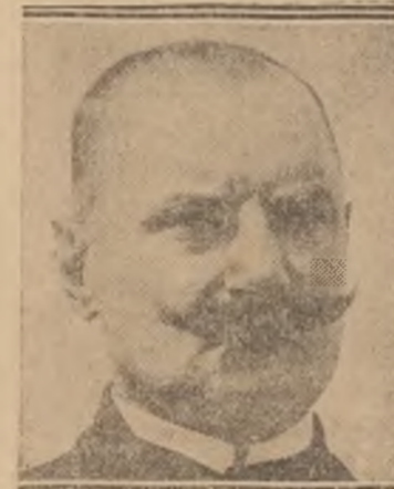
Dr. BALTHAZÁR REFORMÁTUS PÜSPÖK AZ "AQUITANIA" HAJÓN UTAZIK HAZA.

Ezeknek a kis bányáknak a szén termelése nem kerül többbe, mint 2.50-2.80-ba, akkor nagyon elég lenne, ha a szénért 3.50-3.80-at kapnának, még ha tekintetbe vesszük azt is, hogy ők csakis ilyenkor dolgozhatnak. Indokolatlan és lehetetlen állapot hát, hogy 7—8 dolláros szén árakkal uszorászkodjanak.