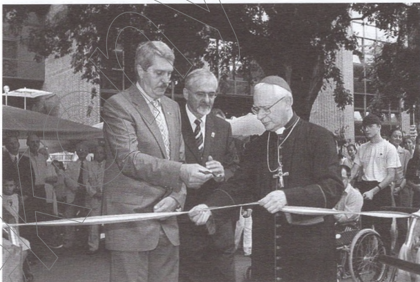
A Dóm feljárójának avatása

A szegedi ill. magyarországi rotary mozgalom 48 éves dermedtségre kárhoztatott. Az újra indulás lehetőségére csak 1990-ben, a rendszerváltás után nyílt alkalom. Az önálló, polgári eszmék elterjedésével párhuzamosan, fokozatosan alakultak meg hazánkban is a klubok, jelenleg 44 klubban több mint 1000 tag tevékenykedik. A tagság – a rotary elveknek megfelelően – a társadalom széles rétegeiből tevődik össze, mintegy leképezve annak szerkezetét. 2007-ben lehetőség nyílt arra, hogy a magyar klubok önálló, saját maguk által választott kormányzó által vezetett kormányzóságba tömörüljenek és önállóan szervezzék a magyarországi rotary éle-