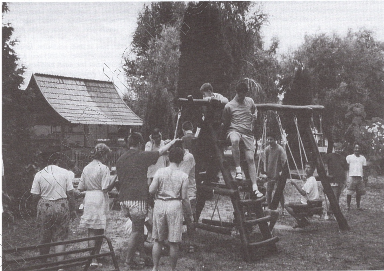
Ajándék-játszótér a Waltner Károly Gyermekotthonnak