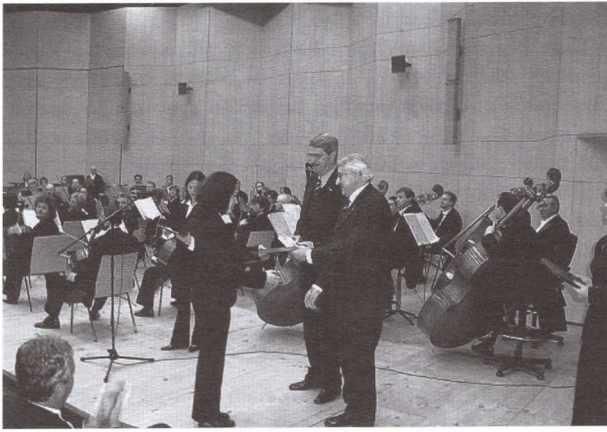
Rotary ösztöndíj átadás

magyar nyelvre, kultúrára, népművészetre, történelemre a csángó nebulókat. A ház berendezésének anyagi fedezetét, a magyar rotary kormányzóság vállalta magára. Másik nagy csángó projekt, a Kostelevi magyar közösségi ház kialakítása volt. Az anyagi terhek nagyobb részét, a klub egyik tagja szervező munkájának és ismeretségének köszönhetően, civil szervezetek és emberek adták össze. Ide kapcsolódnak azon a támogatások, amit Bőjte Csaba testvér által létrehozott dévai gyermekotthonnak biztosítottak ruha, játék és számítógép adományok formájában. Ugyan csak számítógépek és fénymásoló adományozásával támogatták a csángó iskolák magyar nyelvi tanítását.