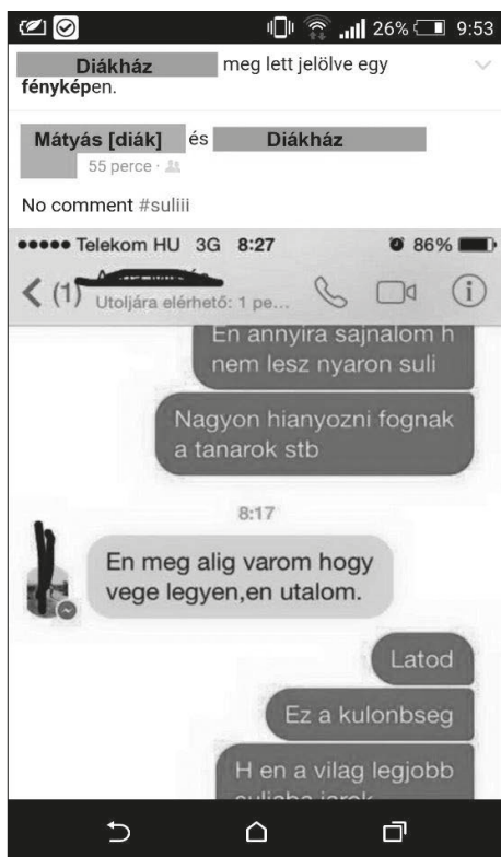
4. kép. „A világ legjobb sulija”