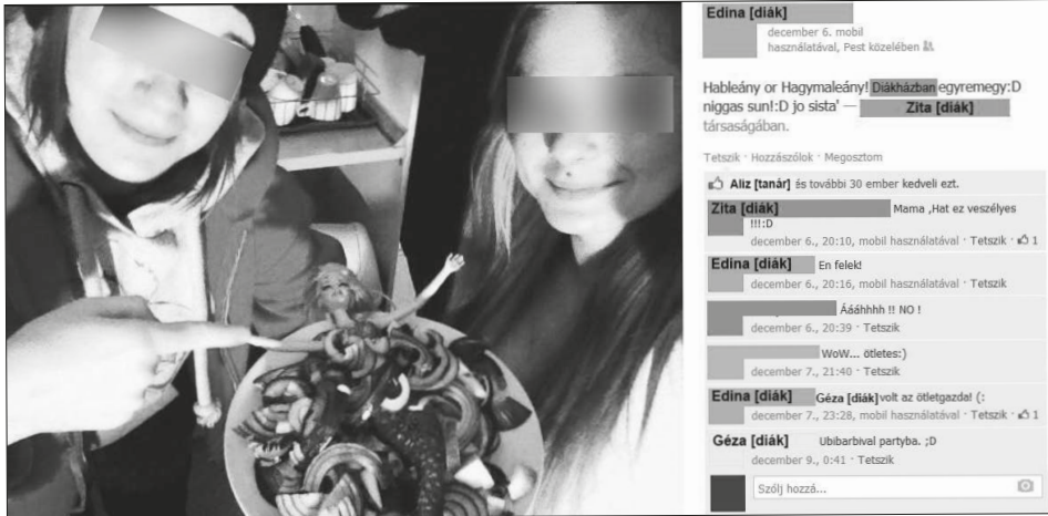
2. kép. „Haleány or Hagymaleány”