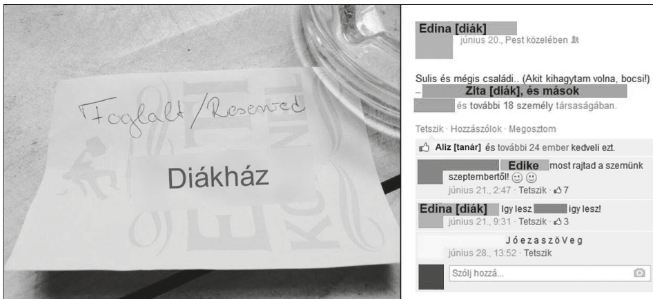
3. kép. „Sulis és mégis családi”