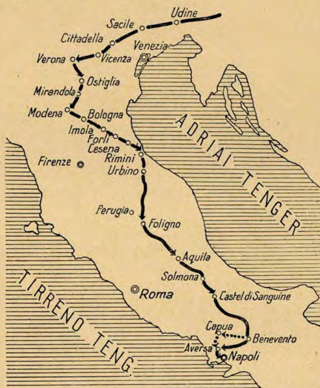
Nagy Lajos 1-ső nápolyi hadjárata 1347.

vagból álló főszereg élén. A király seregének útját az alábbi vázlat mutatja: