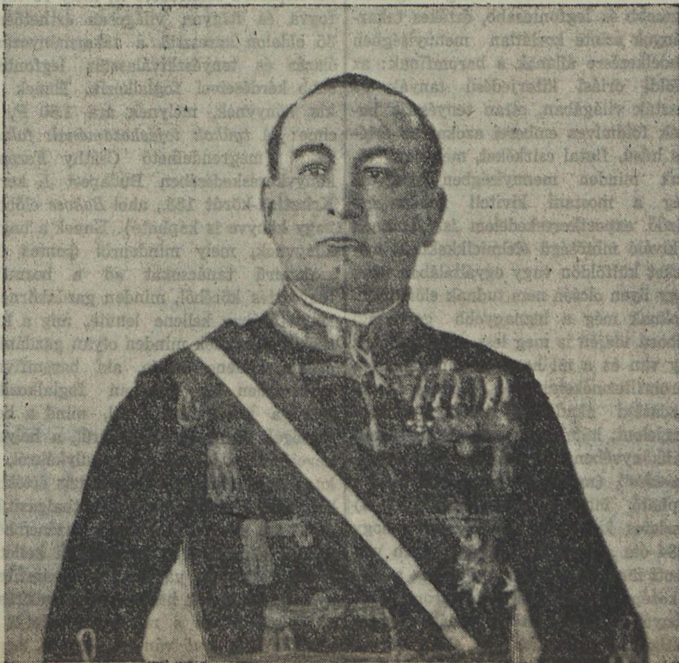
Gömbös Gyula, a legkomolyabb miniszterelnökjelölt

mára a többséget. Az ő megbízása esetén több pártokivüli politikus is támogatná az új kormányt s így egyelőre