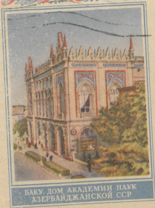
БАКУ. ДОМ АКАДЕМИИ НАУК АЗЕРБАЙДЖАНСКОЙ ССР

Издание Министерства Связи ССР из 1986 г. в 1982 г. Москва. Цена конверта с маркой 50 к.