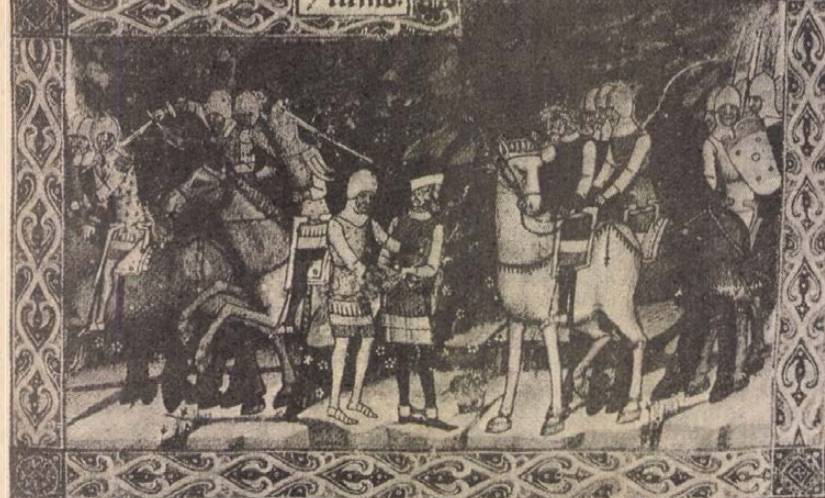
Gyula elfogatása a Képes Krónika miniatúráján.