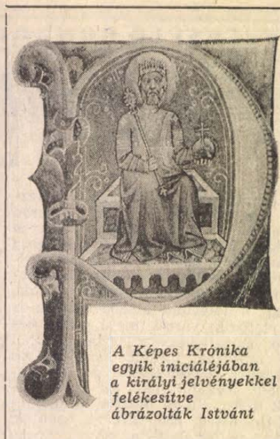
A Képes Krónika egyik iniciáléjában a királyi jelvényekkel felkészítve ábrázolták Istvánt

Gizella és István nászából számos gyermek született, köztük kései forrás egy Ottó nevűt említ, kortárs források pedig Imre fiukról szólnak. Mivel Imre eredeti neve a latinus Heinricus , illetve a németes Heinrich volt (amelyből csak utóbb alakult ki