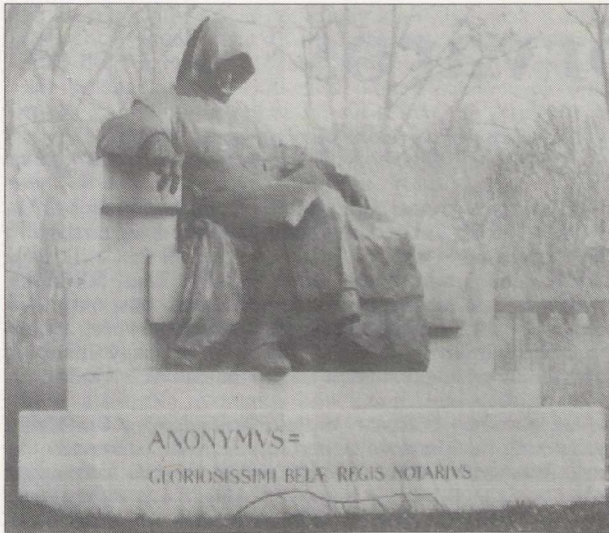
Ligeti Miklós: Anonymus