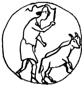
A. H. S. Székely - alkalmi rajzok - v. 1927