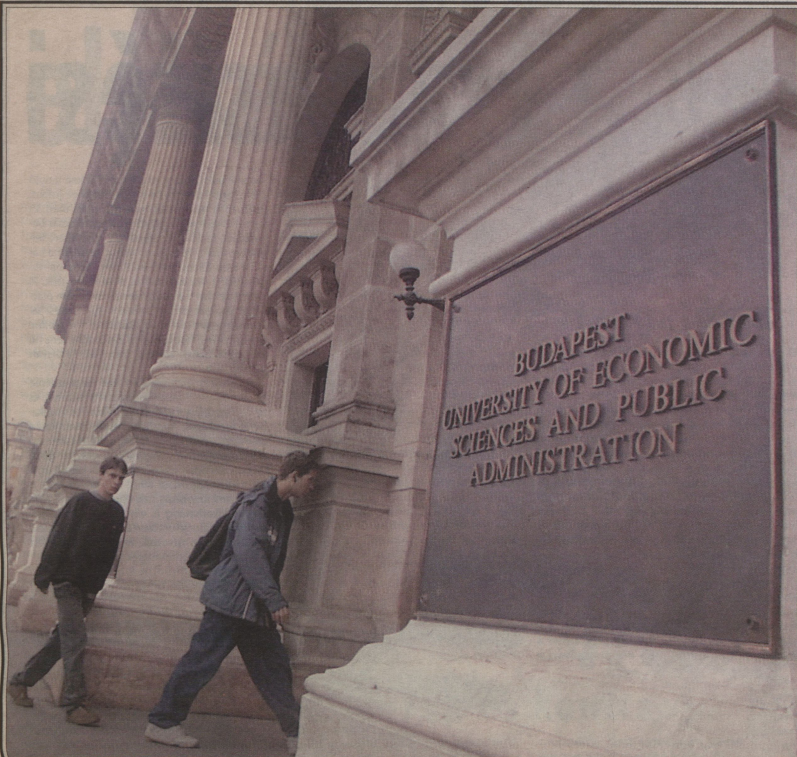
A gazdasági szakok a legnépszerűbbek a 2001/2002-es tanévben is.