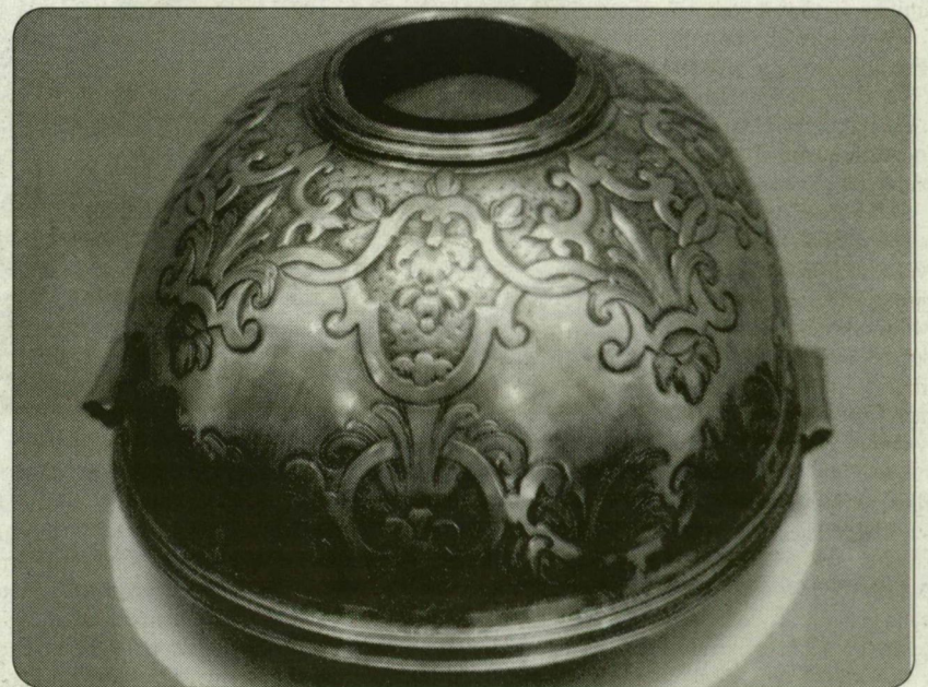
Szent István koponyaereklyéje.