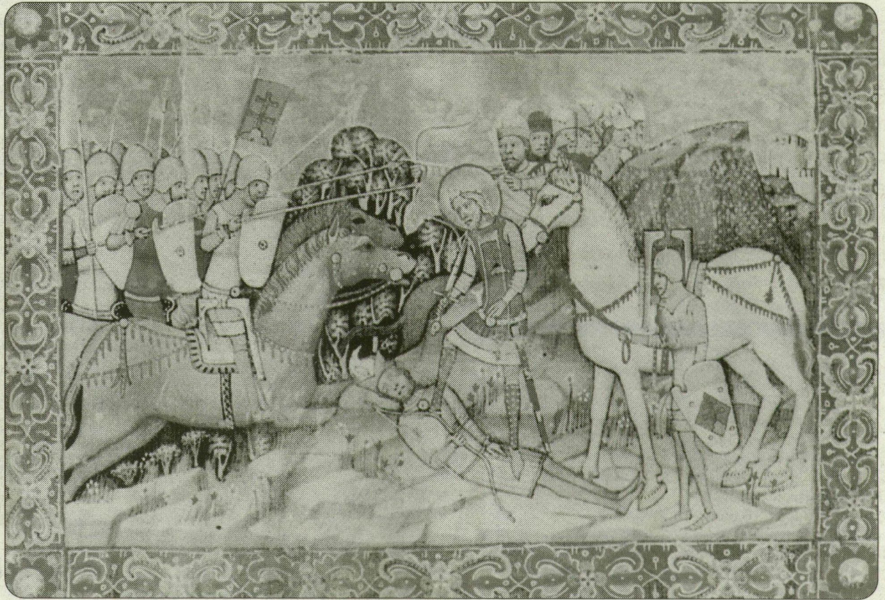
István győzelmet arat Keán bolgár vezér felett. Miniatúra a Képes Krónikából

– A csatlakozás többet jelent, mint az illeszkedés. A csatlakozással Nyugat-Európa részévé vált volna Magyarország – ez a magyar fejlődésben soha nem valósult meg. István korában rendkívül erős modernizációs kísérlet zajlott le, amely magában foglalta a közigazgatás megszervezését, a vérsé-