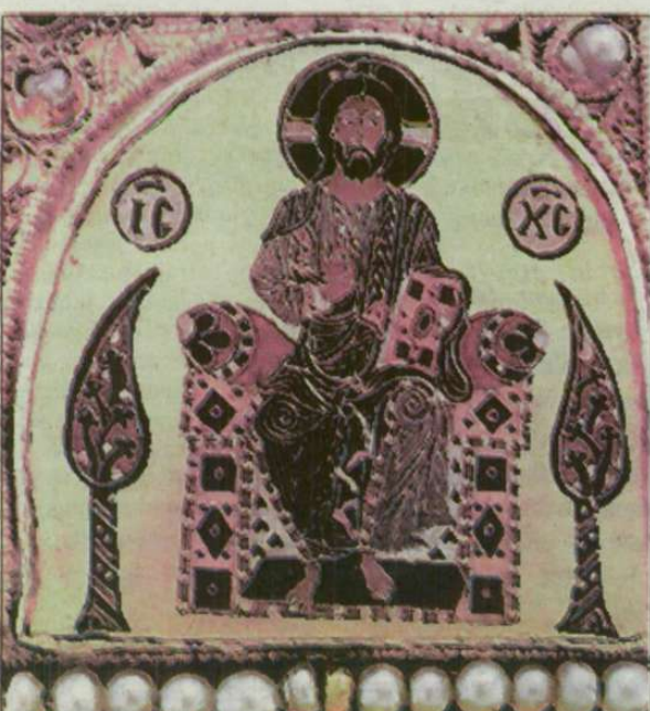
A Pantocrator zománcképe a corona graeca-n.