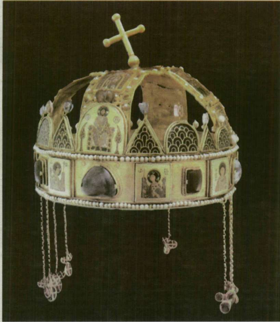
A magyar Szent Korona egy bizánci eredetű alsó és egy latin felső részből áll.

– Az átadást nagy valószínűséggel kemény diplomáciai tárgyalások előzhették meg. A Hartvik-legenda inkább azt jelzi, hogy a középkorban az utódok képzelete hajlamos volt képiesen megőrizni a fontos eseményeket. Gondoljunk arra, amikor az 1059-es várkonyi jelenetben Bélának választania kellett a korona és a kard között. A népi képzelet ezt úgy adta elő, hogy I. András egy vörös posztón jellemezte a királyságot jelképező koronát és a hercegséget szimbolizáló kardot, s ha Béla a koronát választotta volna,