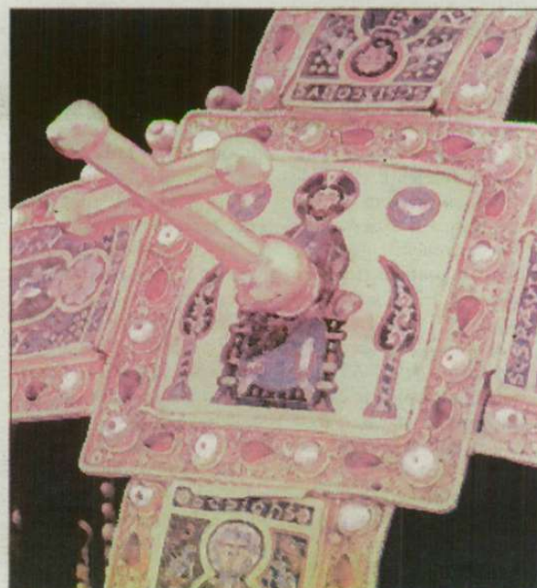
A Pantocrator zománcképe a corona latina-n.