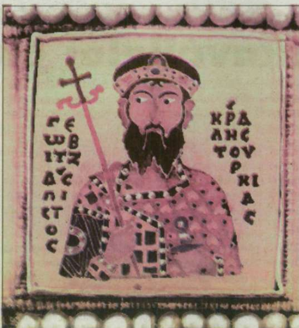
I. Géza magyar király képe a corona graeca-n.