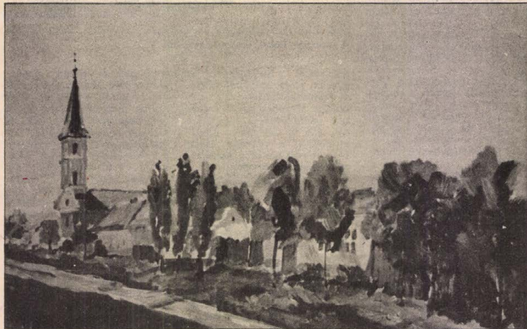
Balázs Tibor: Szülőház

— Szinte nem múlik el napom írás nélkül. A történelemért élek, hogy kortársaink és utódaink minél többet tudjanak meg a magyarság múltjáról.