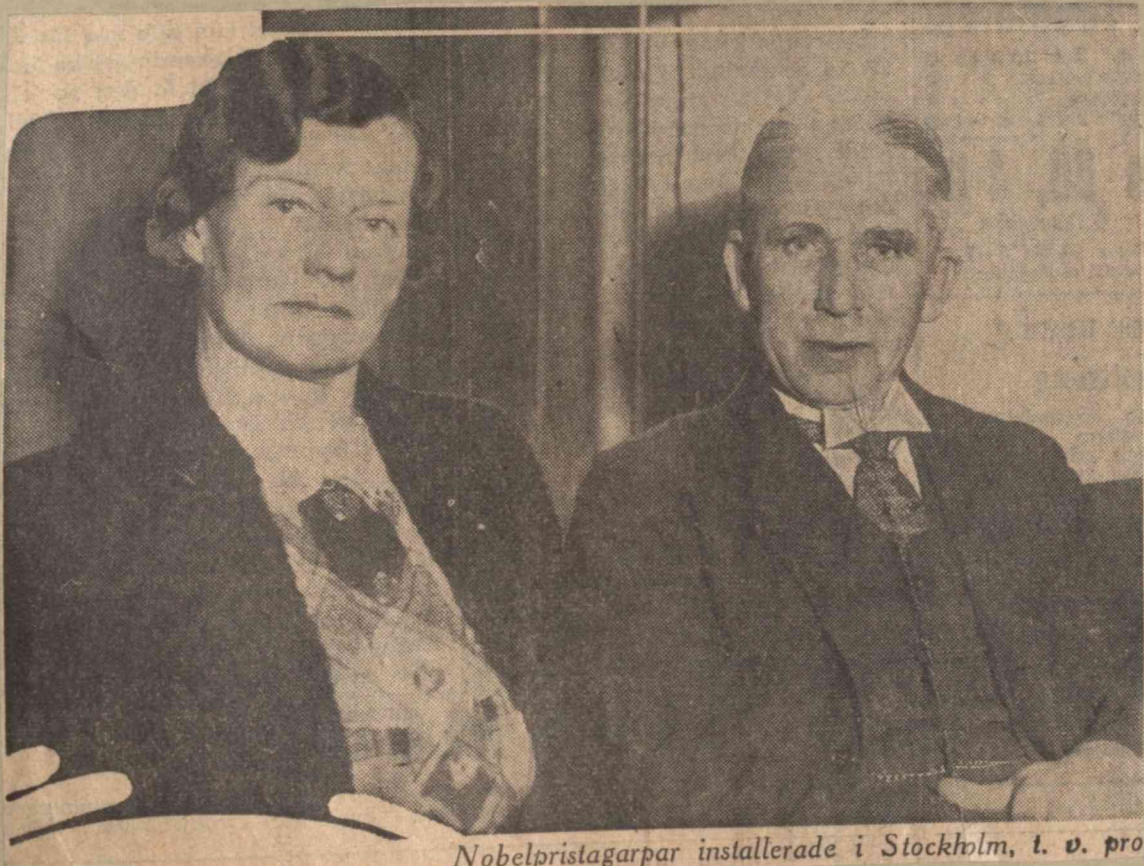
Nobelpristagarpar installerade i Stockholm, t. v. prof.

Vi våga försäkra, att årets Luciafest — i välgörenhetens tecken som aldrig tidigare — i festivitas kommer att överträffa vad man tidigare varit med om. Låt oss mötas i Berns måndagen den 13 december!