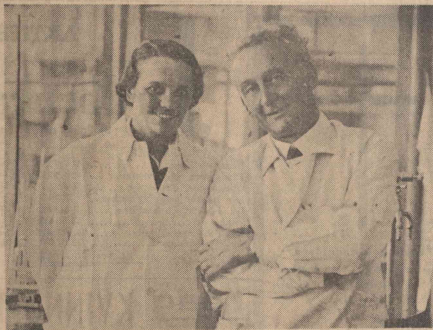
Nobelpristagaren, professor Albert von Szent-Györgyi med maka i laboratoriet i Szeged.