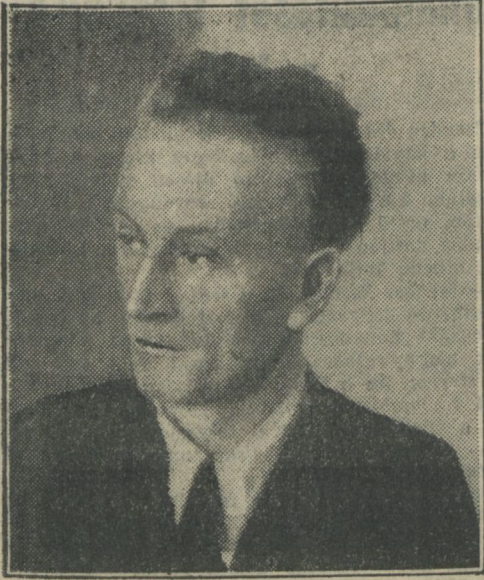
Szent-Györgyi Albert szegedi egyetemi tanár megkapta a Nobel-díjat

Várható időjárás a következő huszonegy órára: Gyenge légáramlás, délelőtt sok helyen köd. A hőmérséklet nem változik lényegesen