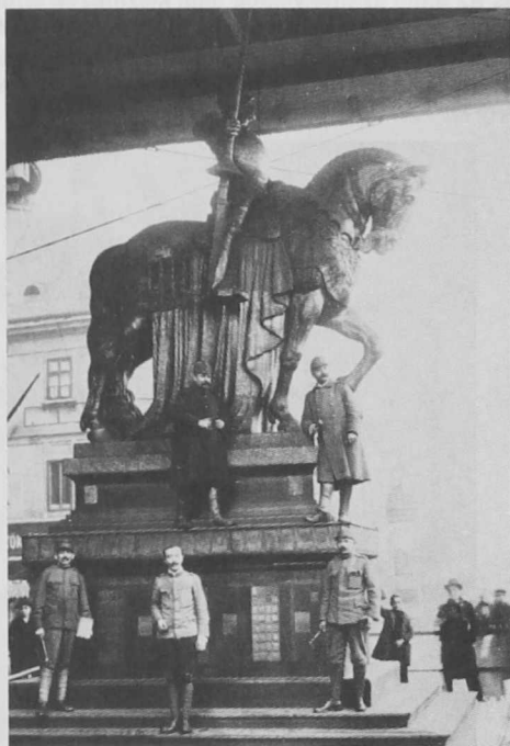
2. ábra A Nemzeti Áldozatkészség szobra pikkelyszerűen beborítva bronz lemezekkel. Budapest, Deák tér, 1915-18.

Végső soron a fényképek mindegyike hordozza ezeket a tulajdonságokat. Ezek közül bármelyiknek előtérbe kerülése azonban nagyon relatív és nagyon szubjektív. Mászt jelent a fénykép a kortársnak és mászt a későbbi generációnak. Mászt jelent a képen ábrázolt személynek és mászt a kívülállónak. Többféle hatást vált ki, különféle gondolatokat ébreszt, különböző érzelmeket kelt