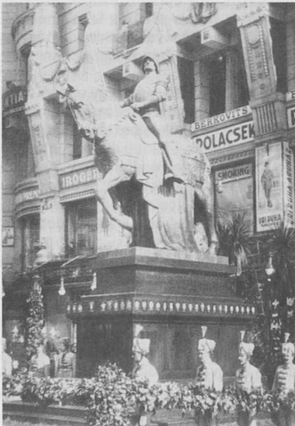
1. ábra A Nemzeti Áldozatkészség szobra a leleplezés után. Budapest, Deák tér, 1915.

Ugyanilyen gyors ütemben tökéletesedett a fényképezési technika. Nagy előrelépést jelentett a negatív-pozitív eljárás felfedezése, melynek segítségével egy felvételt tetszés szerinti számban lehetett másolni. A fotótörténet William Fox Talbot (1800-1877), angol tudós felfedezéseként tartja számon ezt az eljárást, de a magyar Kramolin Alajos-ról (1812-1892) is ismeretes, hogy eredményes kísérleteket folytatott e téren.