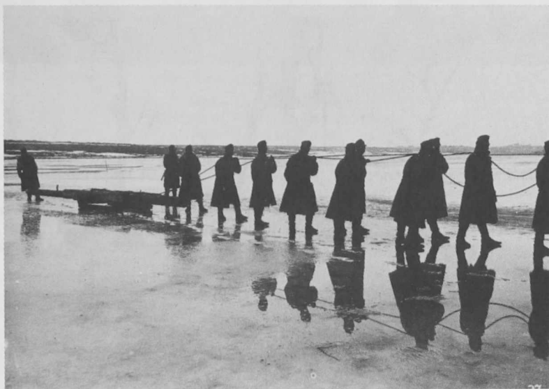
4. ábra Utázmunkálatok a befagyott Strypa folyón. 1915.

Tudvalévő, hogy a fa, kitéve az időjárás viszontagságainak, nem időtálló. A Nemzeti Áldozatkészség szobra sem kerülte el sorsát. Napjainkra majdnem teljesen szétporladt. Ami megmaradt belőle, az a ló fejének egy darabja, a róla szóló leírások és szerencsére