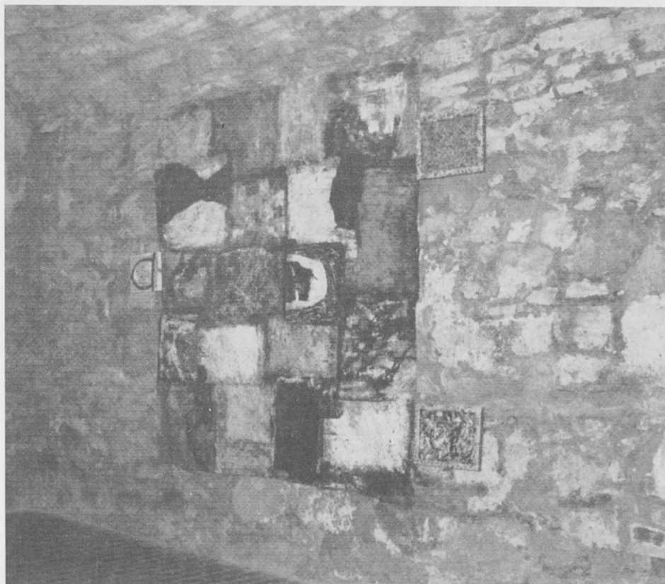
Részlet Bálint István budapesti kiállításáról, 1992.

Az efféle véletlenszerű alakzatok szemlélése bizonyára nem haszontalan szórakozás: már Leonardo is azt ajánlotta festőtársainak, hogy fordítsanak külön figyelmet a felhők látványára, a háború utáni informel festészet sok tekintetben épp a málló falfelületek csodálatos fakturájával kelt versenyre, és hogy a lényegre térjek: 1952-ből fennmaradt egy megdöbbentő fotó, melyen felhők láthatók, amint épp Krisztus-portrévá állnak össze.