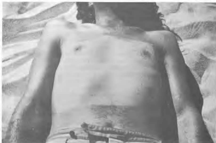
Dennis Oppenheim: Olvasó póz másodfokú égéshez, 1970