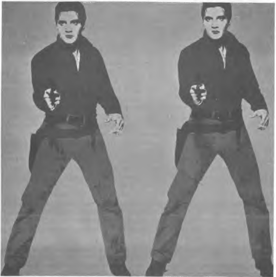
Andy Warhol: Elvis I és II, 1964