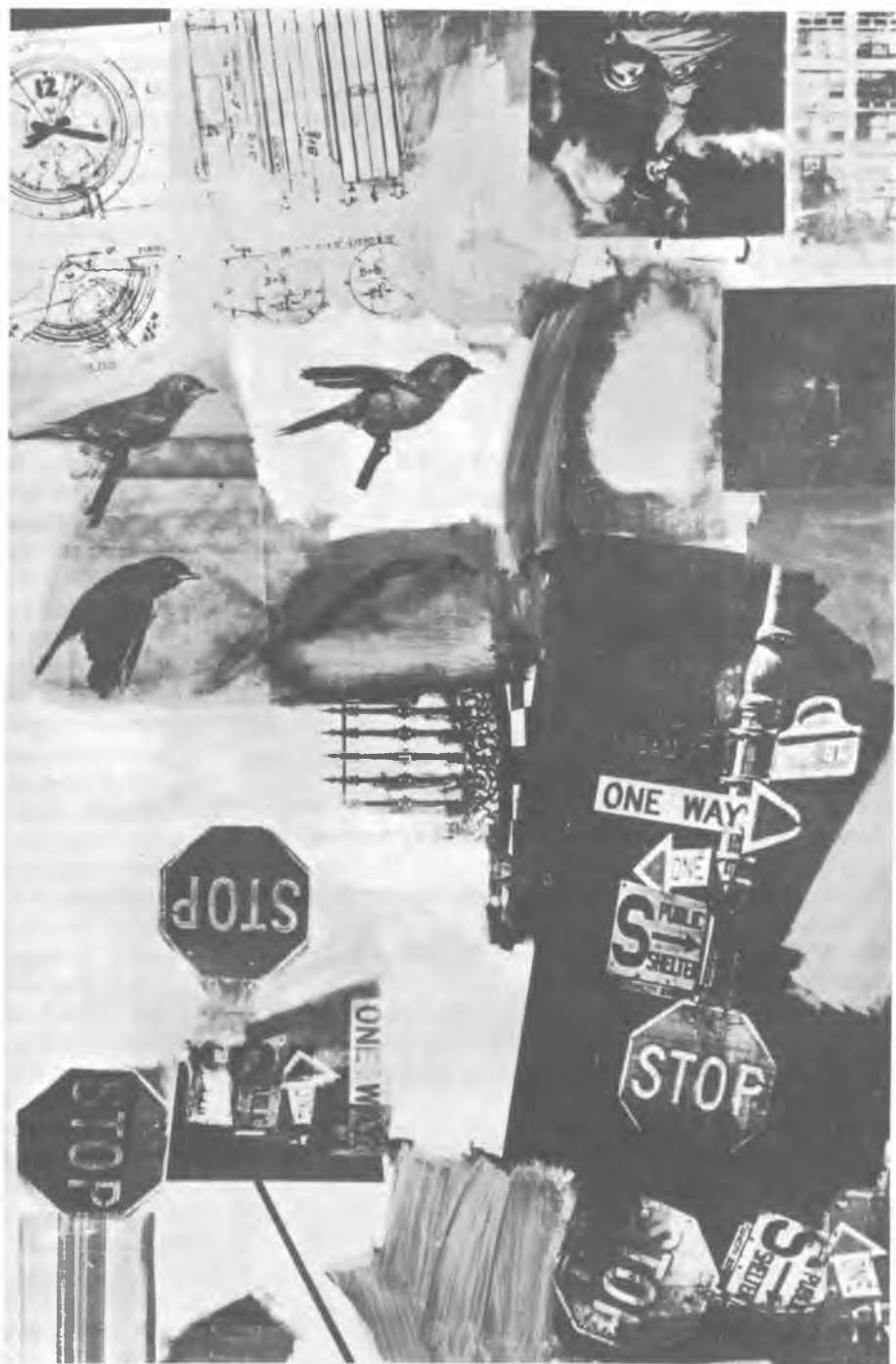
Robert Rauschenberg: Gyorshajtás, 1963