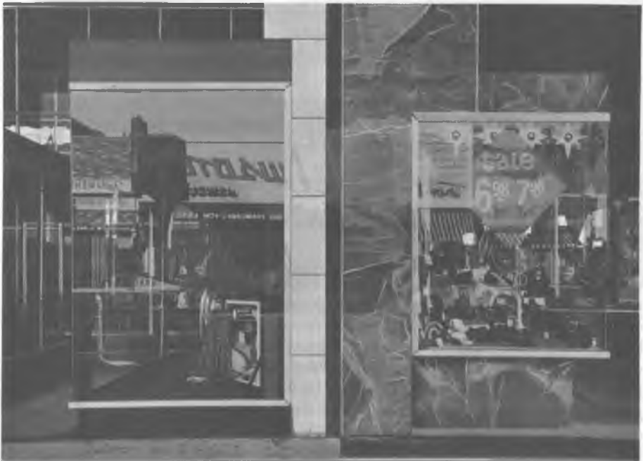
Richard Estes: Minőségi cipők, 1975

A hiperrealizmus és vele együtt a koncept art 1968-70 körüli felfutása – vagyis a direkt képi tematikával szemben a művészet immanens problémáinak előtérbe kerülése – a környezethez való viszonyulás moráljának szélesebb körű megváltozásával van összefüggésben: ez az az időszak, amikor a művészet közvetlen társadalmi hatása és általában a társadalmi aktivitás lehetőségei megkérdőjeleződnek. "Nem ordíthatsz és lármázhatsz folyton, néha suttognod is kell, és ez a suttogás olykor erőteljesebb minden ordítózásnál és akadékoskodásnál, minden hóbörgésnél és