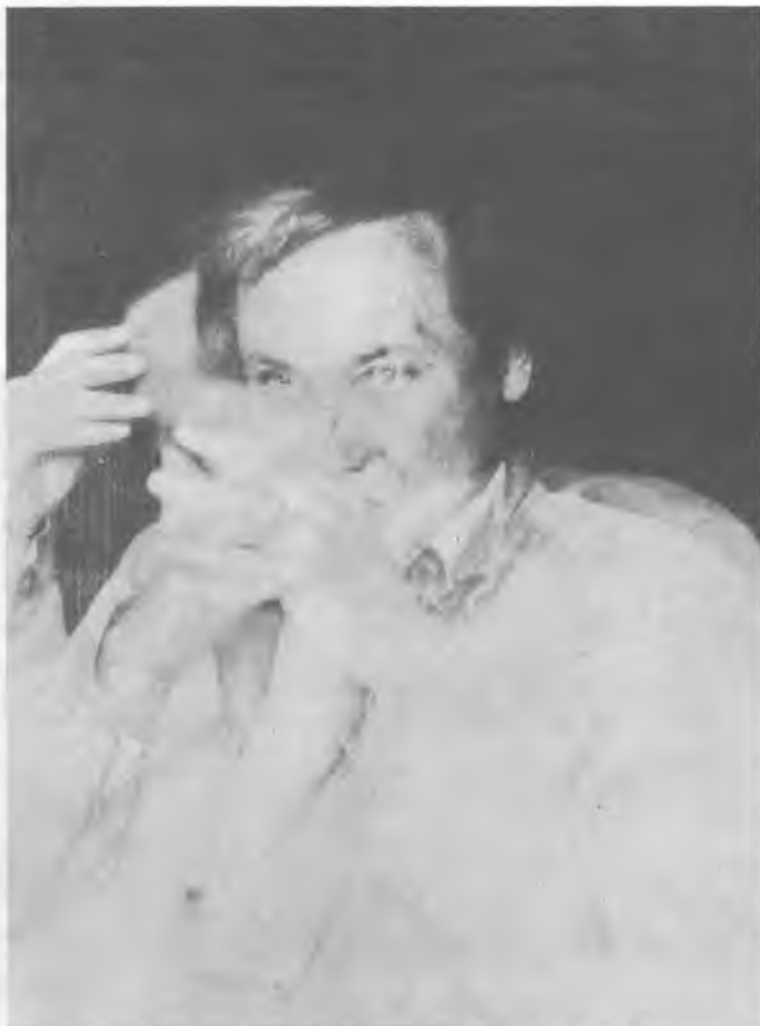
Baranyay András: Rózsaszínre színezett fotó, 1976