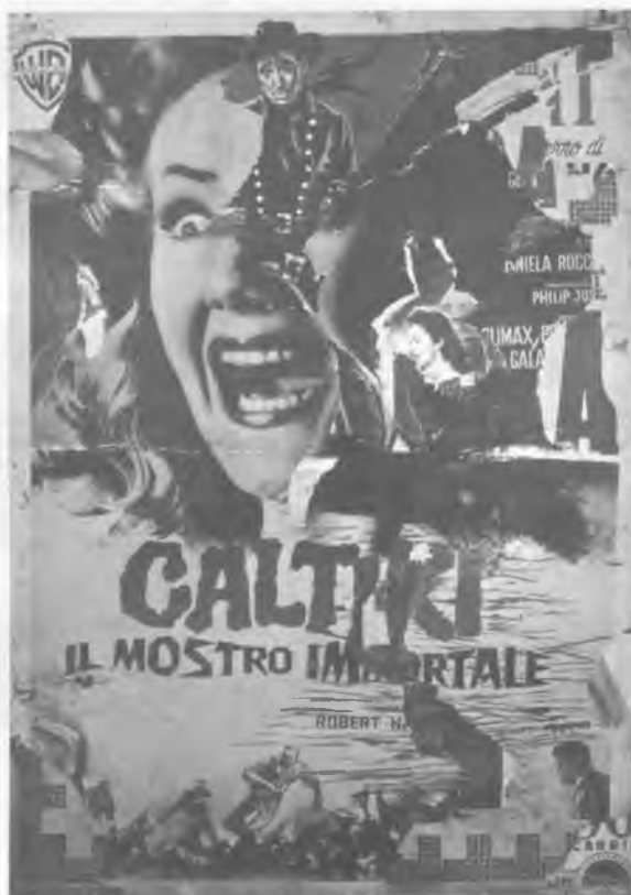
Mimmo Rotella: Il Mostro Immortale, 1961