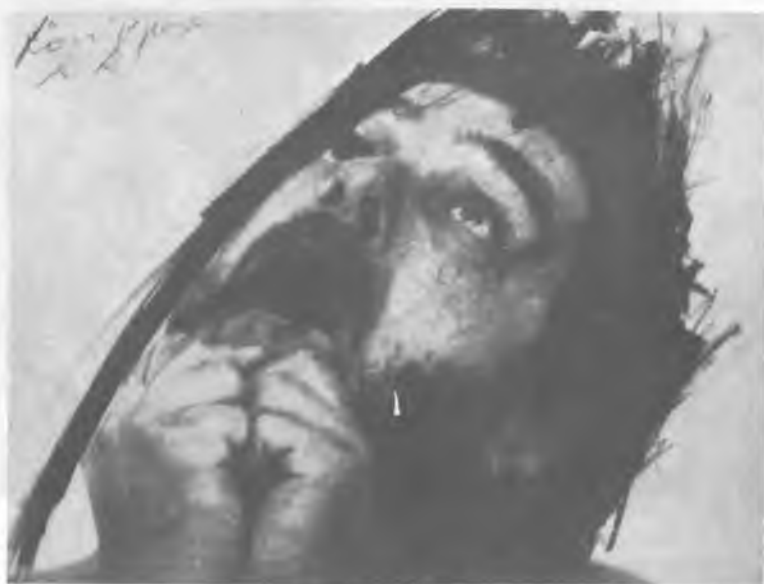
Arnulf Rainer: Önarckép