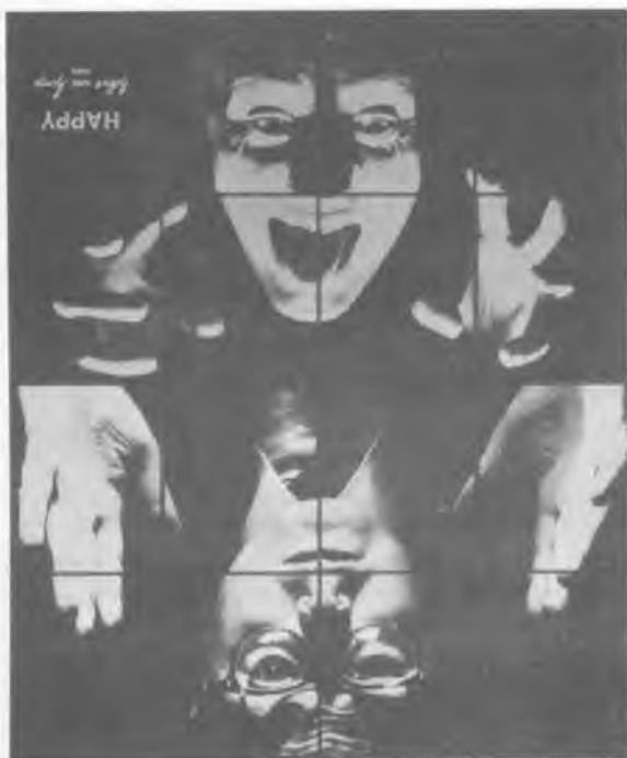
Gilbert és George: Boldog, 1980

A land art művek inkább gondolati átmentést szolgáló dokumentumaival szemben az akciók, performance-ok, body art művek rögzítése az eseménydokumentáció mellett, a fényképezőgép lehetőségeihez mérten, az emocionális vonatkozások "megörökítésére" is módot ad. E területen látszólag a mű és a fotó (képzőművészet és fotóművészet) egymás melletti, partneri működése tapasztalható: mindkét oldal önálló marad, és eredendő tulajdonságait megtartja azáltal, hogy egymástól független