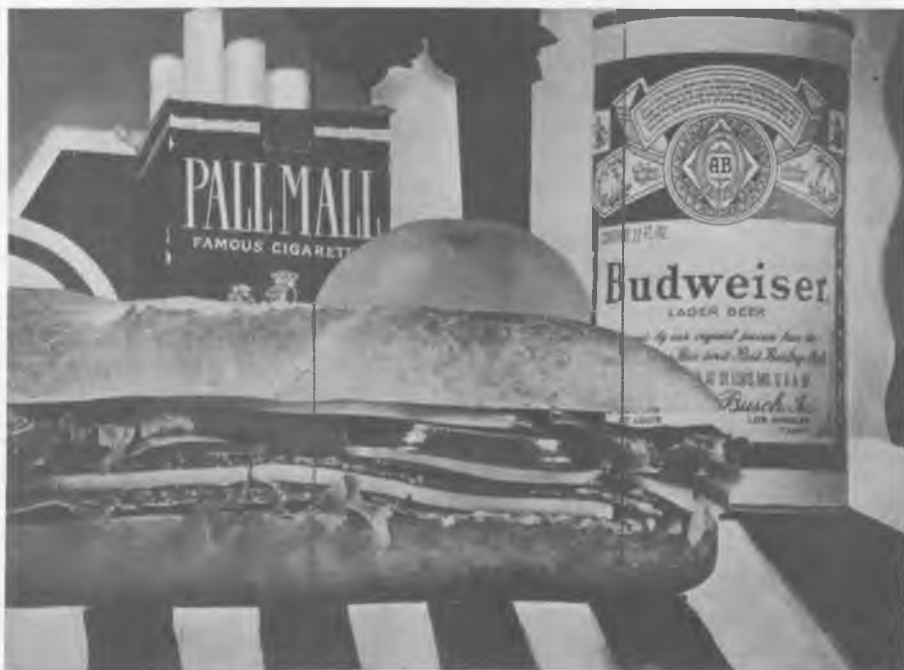
Tom Wesselmann: Csendélet, 1963

Ez az intézményes keretektől kiszakadó, jellegzetesen és tudatosan amatőr jelenség a szentesített anyagok szabad kezelésével, a különböző technikai elemek gátlástalan, gyakran banális kombinációjával egy széles bázisú univerzális kultúra erőterébe tartozik, ahol a műfajkérdés feloldódik a spontán gesztusok bármilyen médium területén való kaladozásaiban – ennyiben a pop folytatása. Ez a gátlásokat levetkőző hozzáállás egy kataklizmán túli művészetet és kultúrát hirdet meg. A tradicionális kereteknek, a fogalmaknak, korhoz kötött kulturális műfajoknak egy univerzális kifejezőkészlet egyenrangú elemeiként van új funkciója, egy mindent magába szívó kultúra jegyében