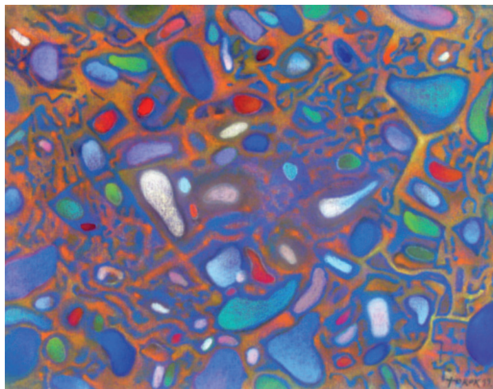
1. ábra. Torok Sándor: Francia nyár , 1999, pasztell, 50x65 cm

például a Francia nyár (1. ábra) című munkájában.