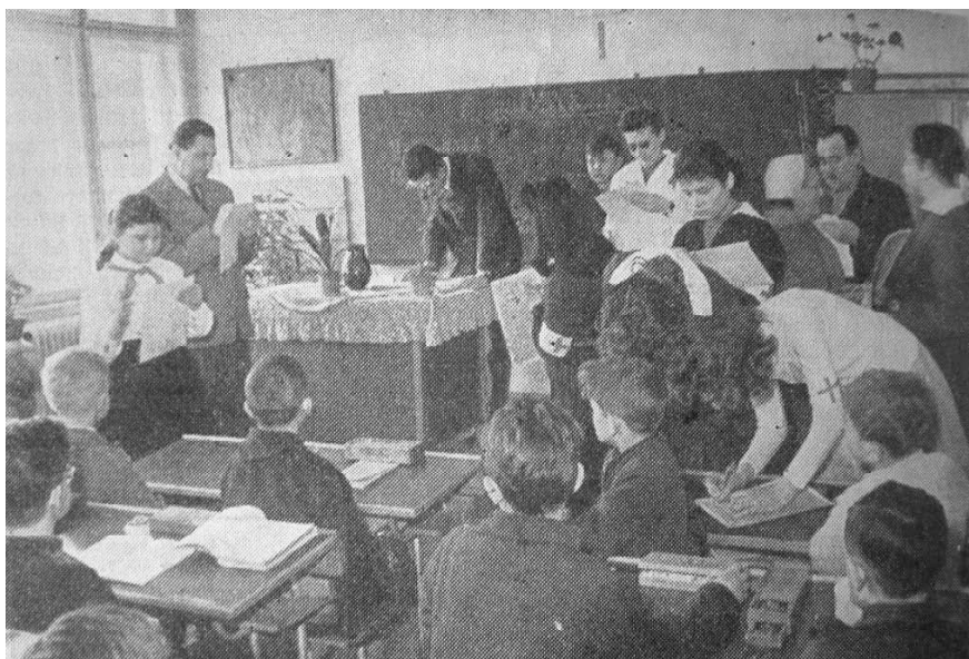
2. ábra. Az osztályterem 1960-ban. Czabán Samu téri általános iskola. Szépítési verseny. Köznevelés, 1960, 13. hátsó borító

Valamennyi bemutatott iskolában a centrális pedagógiai tér az osztályterem. Az osztályteremhez vezető közlekedők révén könnyen el lehet jutni a kisegítő terekhez: ezek közül egyetlenegy alkalommal sem mutatták be a feldolgozott lapok a mosdókat, WC-eket, egyéb mellékhelyiségeket, annál többet az építészetileg tanterem- vagy folyosó-kinézetű könyvtárat, a jól felszerelt, de zsúfolt szertárakat, a tanári, illetve igazgatói irodákat.