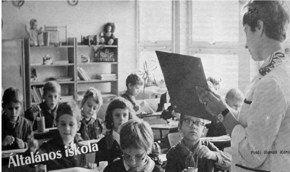
6. ábra. Általános iskolai rajzóra. Köznevelés, 1973. május 18. 3.

Az osztálytermi munkát ábrázoló sajtófotó nem a mellette található közlemény illusztrációja. A tantervmódosítást elrendelő útmutatást, azaz a tananyagcsökkentést, a pedagógiai-metodikai korszerűsítés szükségességét, a szervezeti feltételek fejlesztését tartalmazó 1973/74. tanévben életbe lépő rendelkezést értelmező cikkben többször előfordul a készségfejlesztés szorgalmazása. Az iskola e funkciójához illeszkedik az esztétikai nevelés, amely egyidejűleg több tantárgy feladata, de különösen a művészeti jellegű tantárgyaké.