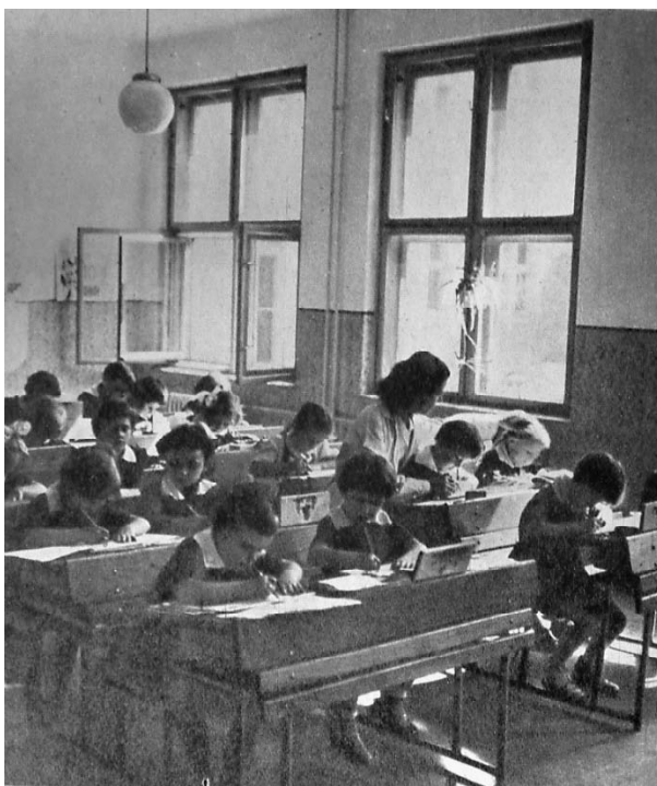
4. ábra. Olvasmányaink képeken: Béke. A tanító, 1968, 2. 12.

Az iskolai tér a '60-as évek neveléstudományi sajtójának képanyaga alapján az intézményes tudásátadás helyszíne. Egyszerre szolgálja a rendszerbe foglalt s kanonizált ismeretek megfelelőnek gondolt átszarmaztatását, végső soron az akkori világkép, az annak részét képező emberkép, műveltségkép stb. tételes reprezentációját, hozzájárul a hatalmi terekben elvárt mentalitás kialakításához, ugyanakkor – a nem csak az iskola intézményéhez kötődő egységei által – része a nem intézményes tudásátadásnak is. Benne nem csupán oktatás zajlik, hanem annál körvonalazhatatlanabb, foszlékonyabb, a mentalitáshoz kapcsolható eljárások is, így például a test, a tér, az idő, a nyelv, a képi szimbólumok stb. használata is.