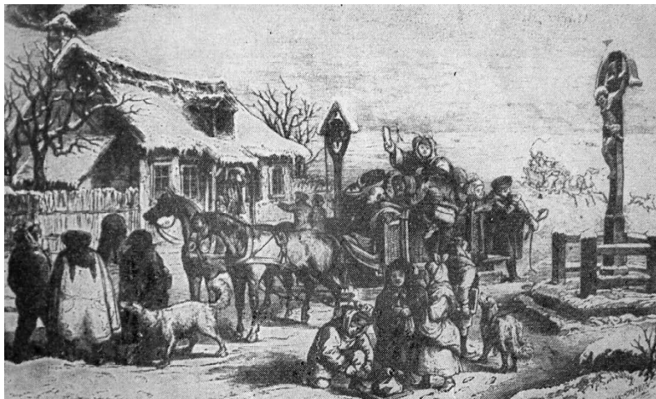
1. ábra. Pusztai iskola. Egykori rézkarc (A magyar nevelés történetéből 5.) Köznevelés, 1960, 5. első belső borító.