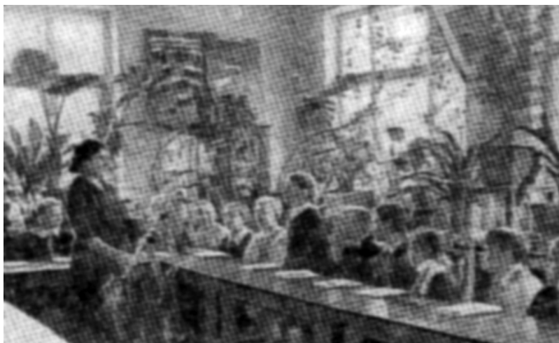
5. ábra. Biológia óra az egyik szupinói iskolában. Fénykép készítője ismeretlen. Köznevelés, 1959.

Stupinó, a mai Oroszországban elhelyezkedő kisváros, a moszkvai régióhoz tartozik.