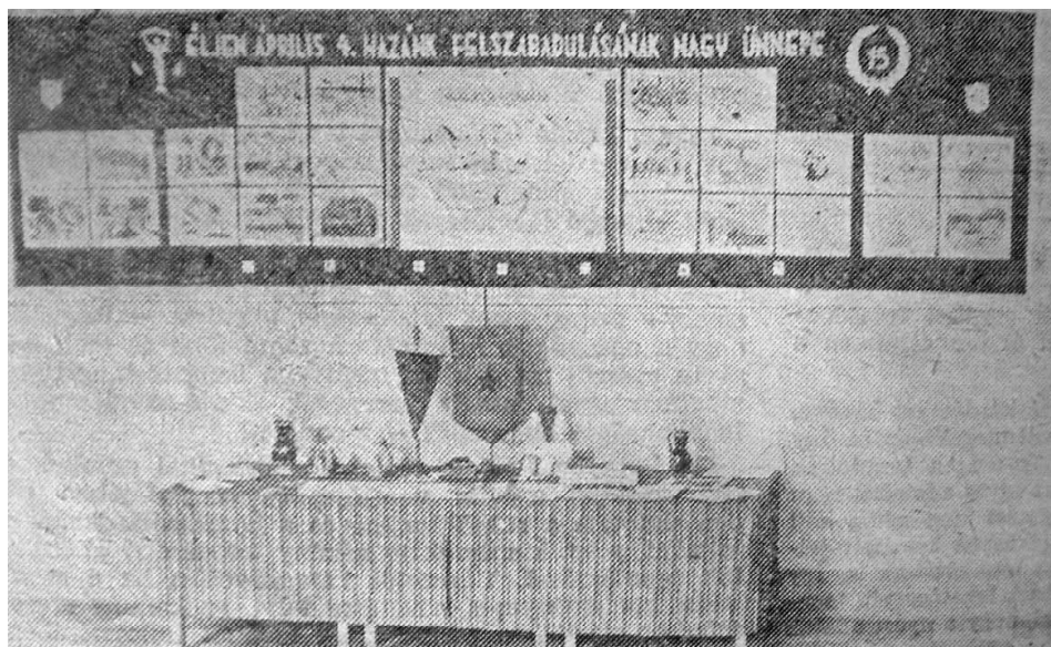
3. ábra. Kiállítás a Bartók Béla úti leányiskolában. Köznevelés, 1960, 9. 284.