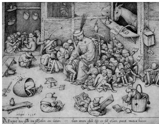
6. ábra. Szamár az iskolában, 1556, toll és tus, Staatliche Museum, Berlin