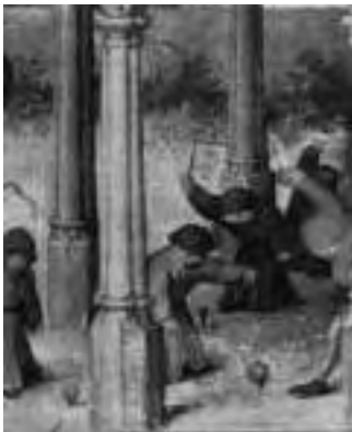
5. ábra. Gyermekjátékok, részlet, pörgettyűzés, csigázás

A Gyermekjátékokon szereplő motívumokat más korabeli és következő évszázadban készült metszeten is megtalálunk. Comenius Orbis Pictus ában láthatjuk a korcsolyázás,