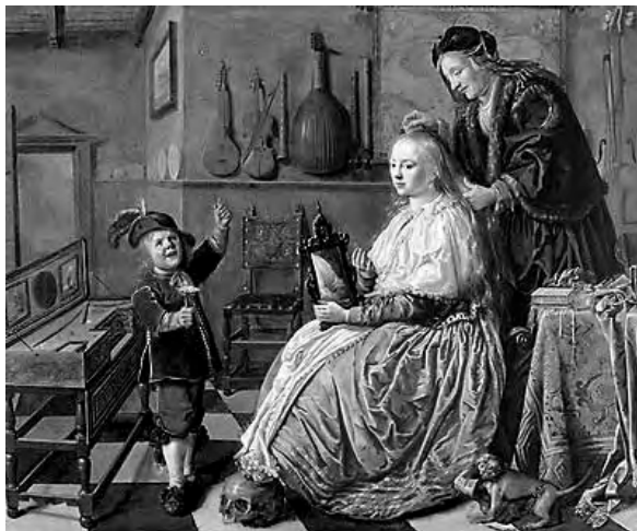
7. ábra. Jan Miense Molenaer (kb. 1610–1668): A hiúság allegóriája , 1633, olaj, Toledo Museum of Art, Toledo, Ohio

mellett a kép középpontjába állított fiát. Talán ez már a reformáció által felkeltett fokozottabb gyermekek iránti érdeklődést fejezi ki, vagy épp felhívja a figyelmet arra, hogy a gyerekek és a gyermekkor megértésének nagyobb figyelmet kellene szentelni. A képen a szappanbuborékat fújó gyermek egyértelműen fel akarja hívni anyja figyelmét magára, de ő csak saját magával foglalkozik, vizsgálgatja magát a tükörben.