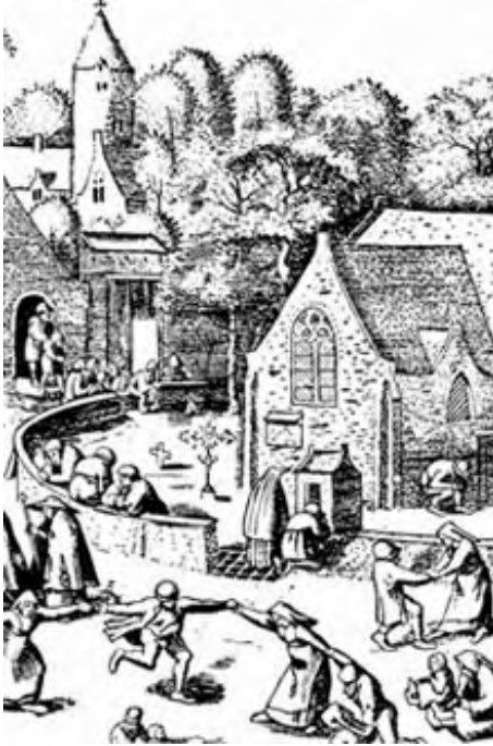
1. ábra. A vásár Hoobokenben, 1559, rézmetszet, részlet

állt attól az elképzeléstől, amit manapság egy temetőről gondolunk. A kép egyébként egy vallási fesztiválhoz kapcsolódó vásári forgatagot ábrázol.