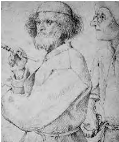
2. ábra. A festő és a műértő (részlet), toll és tus, kb. 1565–68, Bécs, Albertina