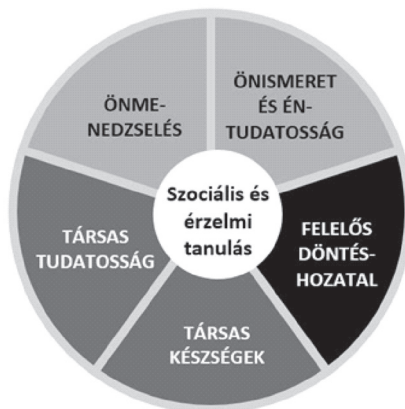
1. ábra. A SEL-programok fejlesztési területei

Az intézményes fejlesztés lehetőségeivel foglalkozó kutatók (pl. Elbertson, Brackett, Weissberg, 2009; Schuttel, Malouff, Einar és Thorsteinsson, 2013; Zins és Elias, 2006 ) öt olyan, a szociális és az érzelmi fejlődésben meghatározó szerepet játszó faktort emelnek ki, amelyek fejlesztése kulcsfontosságú. Ez az önismeret és éntudatosság, az önmenedzselés, a társas tudatosság, a társas készségek és a felelős döntéshozatal. Ezzel teljesen megegyezik az USA-ban vezető szerepet betöltő Collaborative for Academic, Social and Emotional Learning (CASEL) chicagói székhelyű szervezet munkatársai által készített modell is, ami az öt fő fejlesztési terület egymáshoz való viszonyát mutatja be (1. ábra).