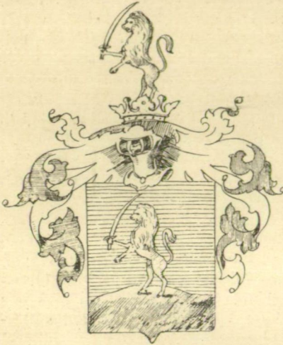
219. sz. Jenei címer 1834.

tartozását s nemesi rangját kimutatni, a mi Szabolcsmegye bizonyítványa 1772. alapján itt s Csongrádmegyében is