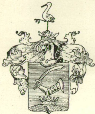
209. sz. Pokomándi cimer.