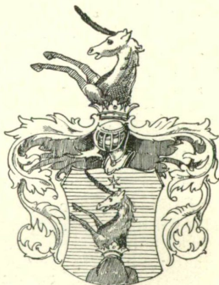
191 sz. Gombos címer.