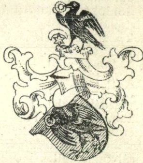
178. sz. A Hunyady család cimere. 1

emelkedett Oláh Miklós esztergomi érseken kívül, a ki testvérhugának fia volt, nem léteztek. Városunk határa melyet Zsigmond király adományából birt, az ő földesuraságában érte el legnagyobb kiterjedését, mint egy ropant uradalom központja. E munka során (II. 140—158 és az egyes falvak történeténél) tüzetesen láttuk uradalmi jogainak történetét, mint igtatták be ismételt ízben 1448., 1450. Vásárhely és tartozékainak birtokába s melyek voltak ezek? mint kapta vissza ez uradalmait a Hercegek okmányhamisítása ellenére 1456.? mint birta Abrányt 1456., Apácaegyházát 143.-55., Csomorkányt 1456., Derekegyházát 1456., Fecskést 1456., Férgedet 1450., Gellértegyházát 1456., Hódot 1450., Kópáncsot 1450., Libecet 1435., Ördögögyházát 1456., Ráróst 1456., Szöllőst 1456., Szilasegyházát 1456., Sámsont 1455., Tárkányt 1456., Tarjánt 1450., Tompát 1436., Tótkutast 1450. és Varjast 1456.? Birtokait halálával édes anyjára és fiára, Mátyásra, hagyta. Mátyás,