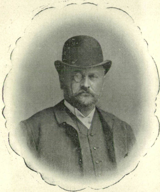
181. Gróf Károlyi Tibor.

elnöke és orsz. képviselő. A család birtokai (város, falu, puszta, részbirtok, házak,) 23 vármegye határára terjedtek ki. Ezekből a legnagyobb szám, 156, Szatmárra esik, Csongrádra 42, Beregre 36, Hevesre 30, Szabolcsra 26, Nyitrára 19, Abaujra 17, Ugocsára