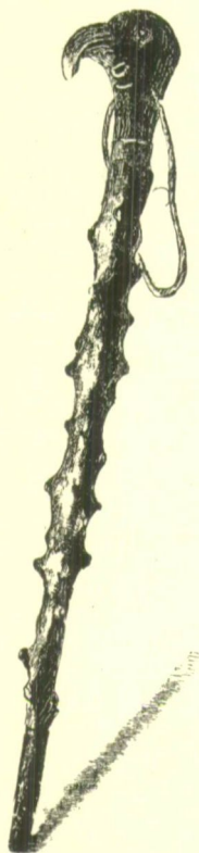
108. sz. Dus István botja. 2

hozzájuk: »Már hét esztendeje«, — így szól hozzájuk szenvedő társai nevében is, — »hogy a tisztek kegyetlensége üldöz bennünket ezen közdologért, azóta vagy tömlöcben raboskodtunk, vagy az orvos-