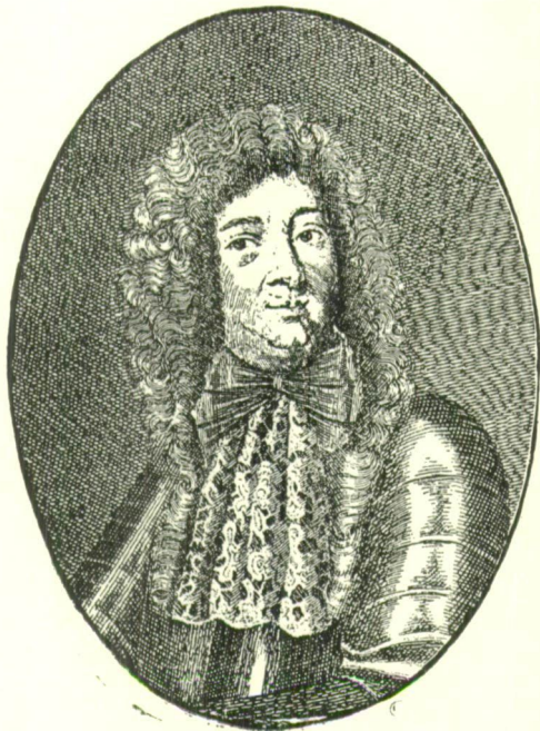
74. sz. Pálffy János nádor. 1

Károlyi tehát végre belátta, hogy a szatmári egyezség alapján nem lehet joga Vásárhelyhez, s hogy az általa felidézett bonyodalmakat szép szerével neki kell elsimitania. Mindazáltal azon kezdte,