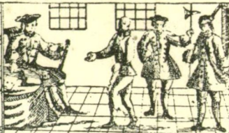
Ich Kommandant Siegt Andrasch, ich vor fünf Dombard an die Fei Szegedini, gestrichelt haben ist aber glücklich Mich Arad gebracht worden in wußt die dem Landman, das ganze Land mit auf 4 Jahr in Ketten an Schanden Condempnirt werden.