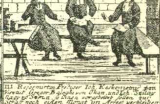
III. Requirierten Prätor Ich Kekes, dem Prätor Gregor B. Siegel von Okan, und Ich Siegel Koz, B. Szilacy, 2 Andras, vorgerichtet sollen zur Weg nach Adara, Almat von Arad vertrieben.

78. sz. Péró és társai bűnhödésök. Szilágyi, Magy. nemz. tört. VIII. k. után.