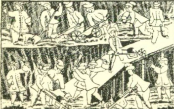
Die Deliquenten, welche in Ketten und Band zu dem Festung von Arad, Landmilitz, bei Arad, und nach Arad die Infanterie als gemeine Mannes gestopfen werden.