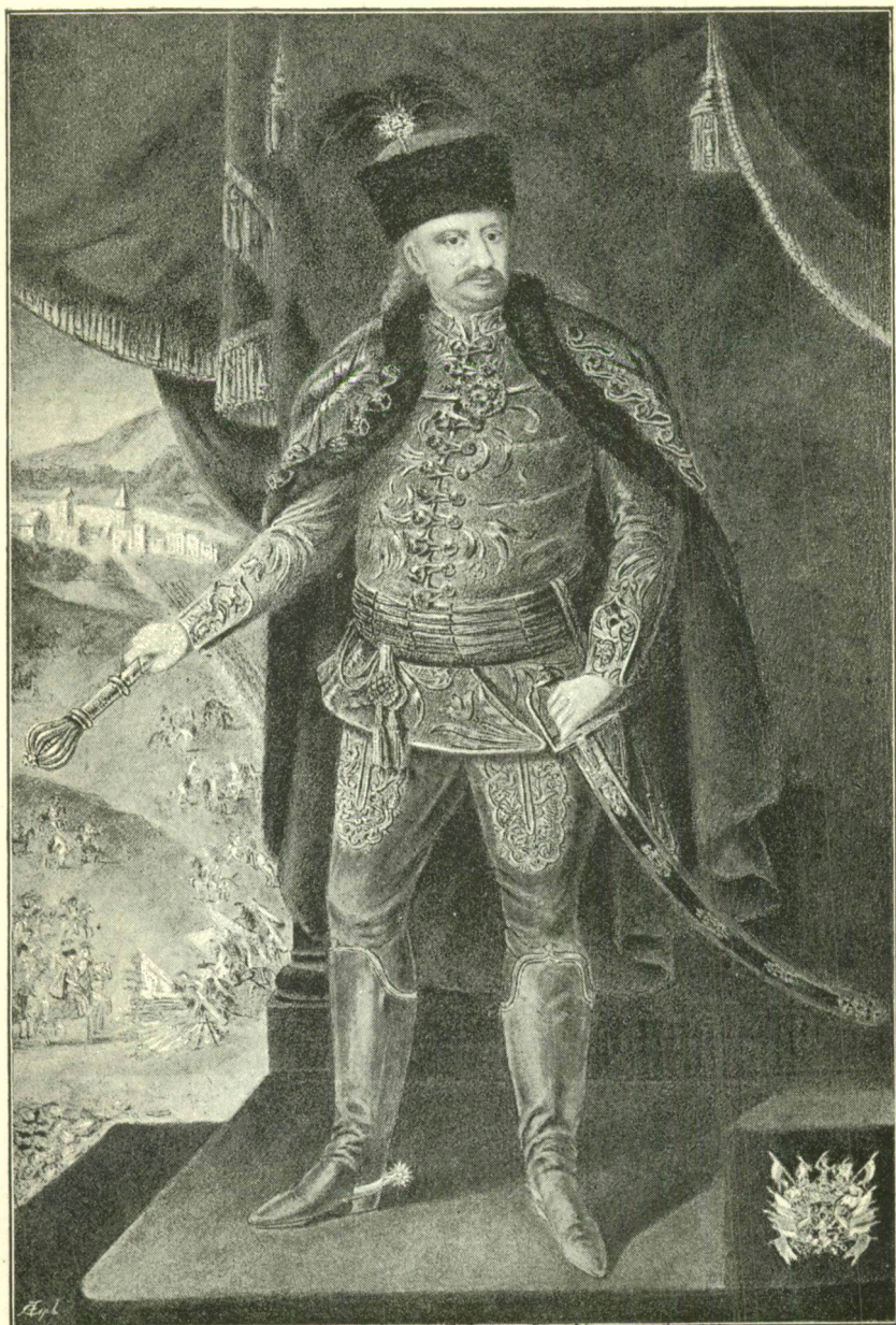
75. sz. Gróf Károlyi Sándor. A gr. Károlyi nemz. It.-nak dúca után.