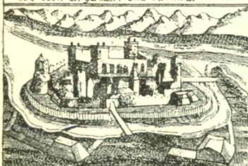
Arad eine große Festung in unser Ungarn auf welche die Tumultuosen einen vergebliche Versuch gemacht zu überwinden.