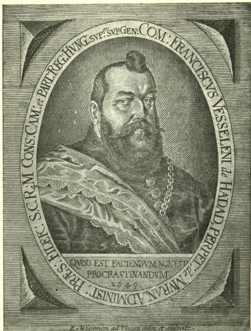
42. sz. Wesselényi Ferencz nádor. Birtokunkban levő egykoru metszvény után.