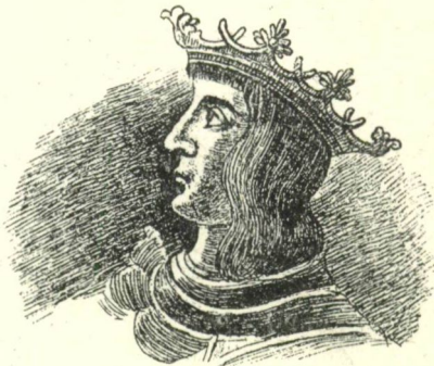
35. sz. II. Ulászló király. 3

Pósaftot végre is a halál akasztotta meg a pereskedésben. Minthogy benne nemzetsége utolsó fia sarjadéka halt el, Mátyás király az eképp rászállott nagy uradalmakat s köztük Kutast is Guthi Ország Mihály nádornak, G. Ország Lőrincznek és Nádasdi Ongor Jánosnak adományozta, 2 bár a Szeri Pósaft György leányai s ezek ivadékai, a Macedoniai, Gyimesi Forgács és Geszti család tagjai, óvást tettek az eladományozás ellen, 4 | 1472