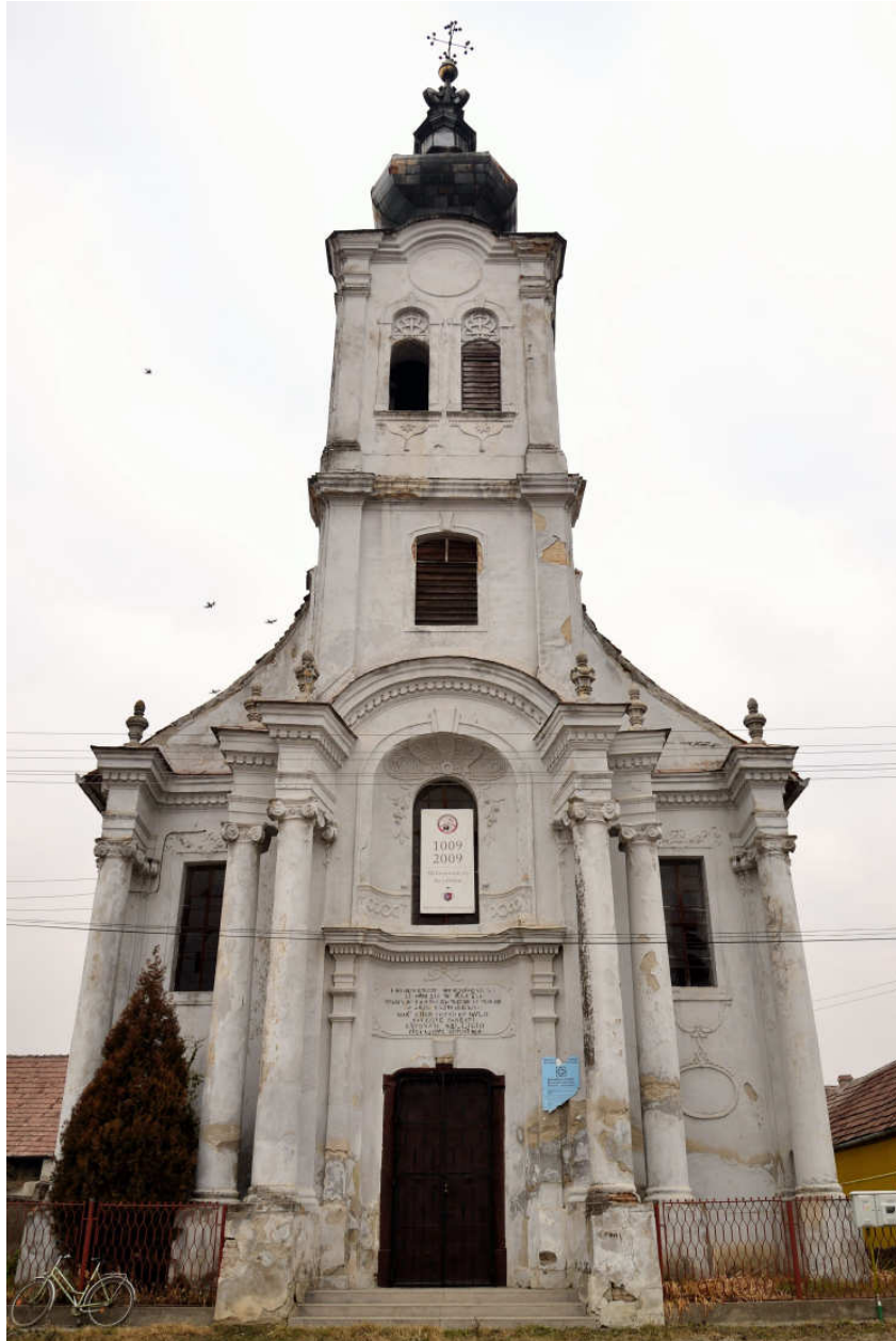
5. The former Mechitarist church