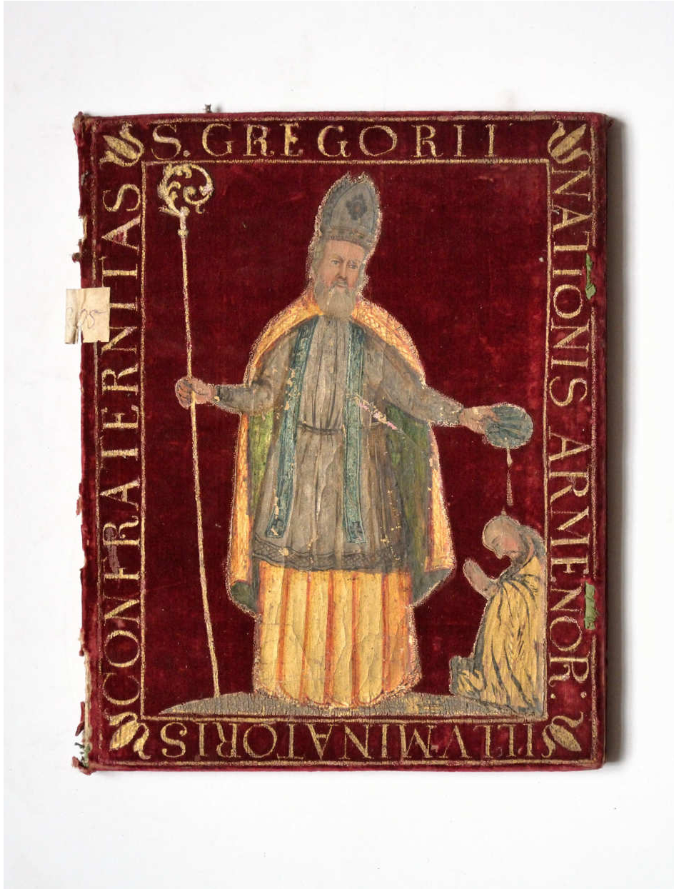
4. Deed of foundation of the Congregation of Saint Gregory the Illuminator (1729)