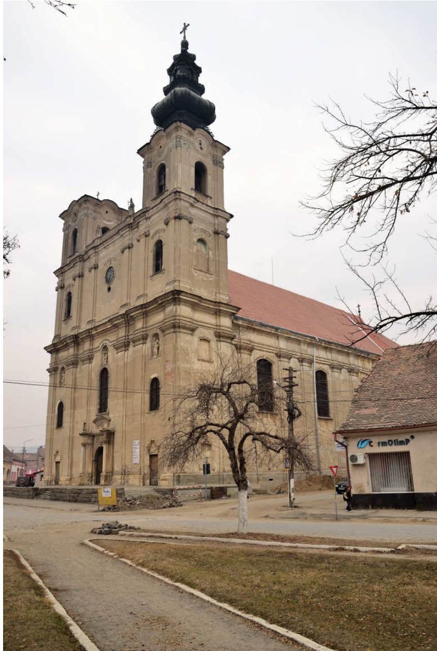
1. Armenian Catholic parish church – Elisabethopolis