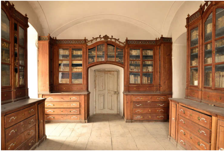
2. The Armenian library of Elisabethopolis