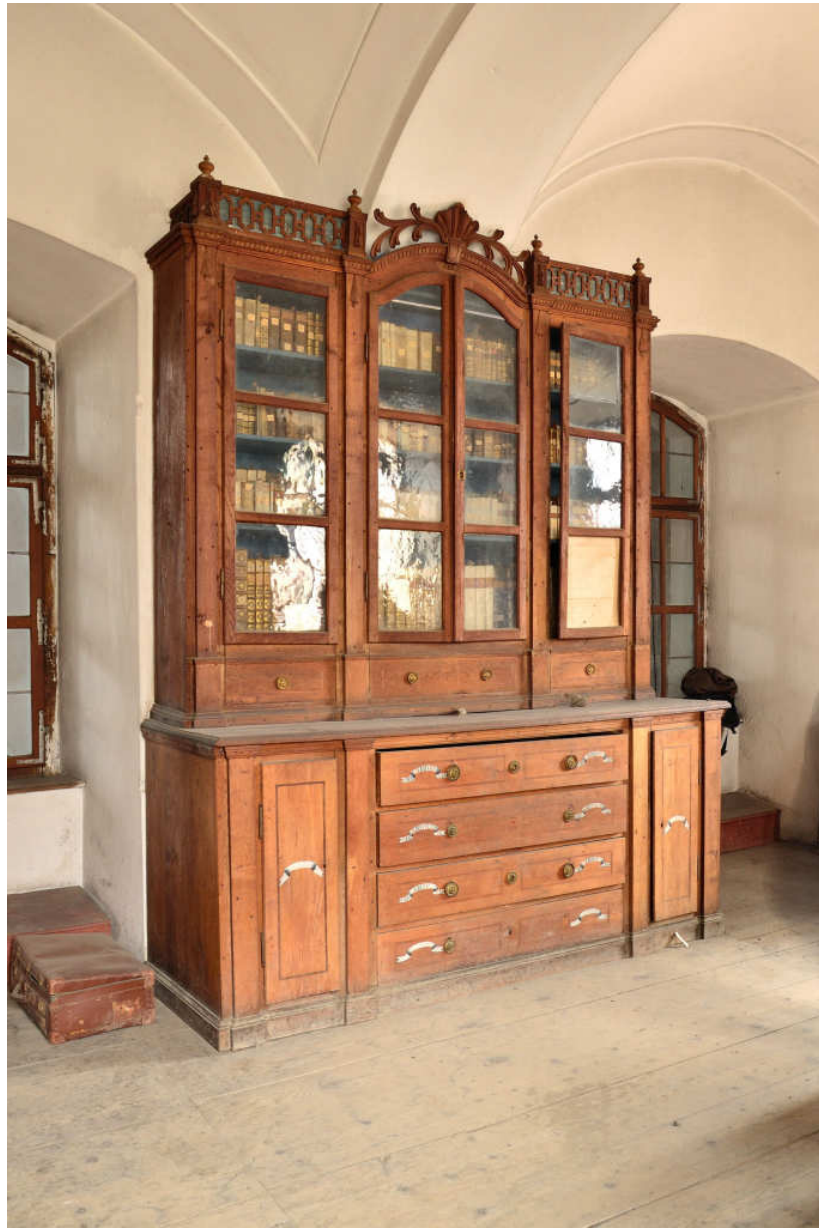
3. Book cabinet in the Armenian library