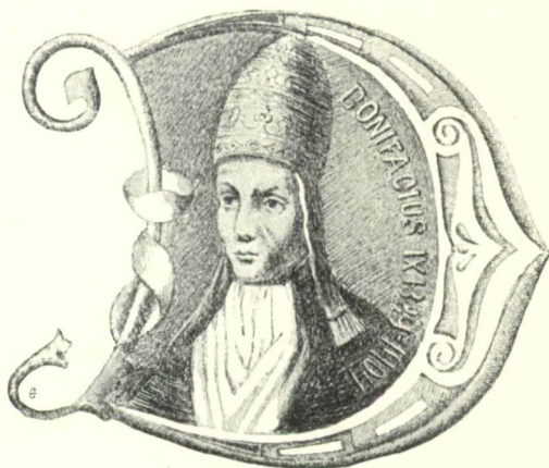
9. sz. IX. Bonifáczius pápa.

IX. Bonifác pápa tehát — hogy tárgyunkhoz közelebb térjünk — 1400. okt. 11-én bűcsúlevelet adott ki a szent-királyi templom javára, 2