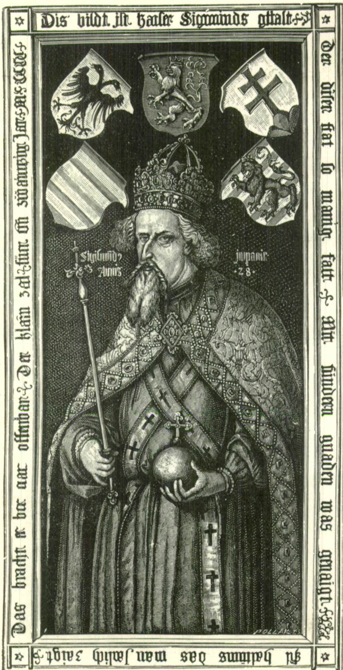
10. sz. Zsigmond király.