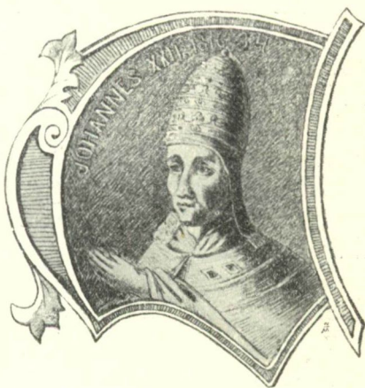
8. sz. XXII. János pápa.

gyekből is jóformán kifogytak, s azért XXII. János pápa (1316—1334) minden tartózkodás nélkül kijelentette, hogy a papok adója „az apostoli kincstár“ javára fordítatik. A hazai papság és Károly király csak kénytelen kelletlen nyugodtak bele az adózásba, melynek foganatosítására János Avignonból, — hol ez időben a pápák laktak, — Berengarii Jakab és Bonofato Rajmond olasz megbízottakat küldte hazánkba, kik ismét alsóbb rendű tizedszedőket 1 alkalmaztak, hogy ezek az adófizetőktől közvetlenül átvegyék és jegyzékbe vezessék az adókat. Sok húzás-halasztás után végre a főpapok és Károly király is szabad kezet engedtek a pápai végrehajtóknak; a király azonban azzal a kikötéssel, hogy az adó harmad része őt illesse, minek ellenőrzése végett Károly a csanádi püspököt, Jakabot, rendelte a pápai megbízottak mellé. Ez utóbbiak igen busás napidíjat (1 \frac{1}{2} —2 arany forintot) fogtak le a beszedett adóból a maguk javára, de, a mi még rosszabb, tiszta kezűségök ellen is súlyos gyanú okok merültek fel. Ez ok-