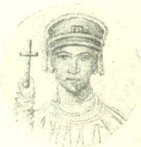
40. sz. Mauritius császár. 1

De Mauritius császárban erélyes és vitéz államfőt nyervén a keleti birodalom, ez derék vezére, Priskos, közreműködésével az avarokat rakoncátlanokodásaikért véresen meglakoltatta. Mikor t. i. Baján ismét a Duna déli partján levő tartományoknak esett, a megerősített városokat lerombolta s szokása szerint pusztított és rabolt: a császári csapatok csakhamar útját szegték s Nikapo- 587 lislánál keményen megverték. Öt év múlva, mialatt mindkét fél erősen készült a mérkőzésre, Baján újra betört a szerencsétlen dunai tartományokba, de Priskos ismét visszaűzte, sőt lábát a Duna északi partján is megvetve, a barbárt Kubin és Pancsova közt iszonyú harcban megverte s csapatait az avarok üldözése végett a Tiszán átküldve, Baján székvárosát is elfoglalással fenyegette. 2 Nem első eset volt ez, hogy e hosszú háború alatt a császári csapatok az avarok földére betörték. Bibor-