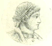
30. sz. Nagy Konstantinus császár. 1

ség esetén 40 ezer katonát adjanak, megszüntetvén egyszersmind az évi pénzt is, melyet a rómaiak a góthoknak egy idő óta fizettek. Ekkép' egy időre meg volt törve a góthok fensősége, mely ez időtájt egyébiránt a Fekete-tengertől a Közép-Dunáig terjedt, mely elhatalmasodásban nem kis része lehetett a birodalom korábbi zavarainak is, melybe t. i. az a többes császárságok (egyszerre két, utóbb pedig hat császár kezelte a főhatalmat), s a polgárháborúk miatt süllyedt, de a mely fejtelenségnek Konstantinus szintén véget vetett, egy maga vevén erős és bölcs kezeibe a birodalom kormányát.