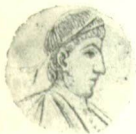
28. sz. Gallus császár. 1

császár kényszerült Pannóniát elhagyni, indultak meg rabló hadjárataikra, melyeket különböző időkben, főleg a szomszédos tartományok | 237 területén újíttak meg. Ugyan ez időtájon kezdődött meg a tőlünk északra eső kárpok, sármaták és góthok nyugtalankodása és előnyomulása is. Utóbbiak ugyanis a Balti-tengertől a Fekete-tengerhez sodortatva, megkezdették vándorlásukat s a Duna alsó részén és a Kárpátok vidékein részint közvetlenül, részint az általuk elűzött és a birodalomba tolakodó idegen népségek által rémítették a nagy birodalmat. Ily módon Dácia gyarmatait már a század közepe óta erősen háborgatták, habár a császárok majd fegyverrel, majd évi pénzzel gondoskodtak azok biztonságáról.