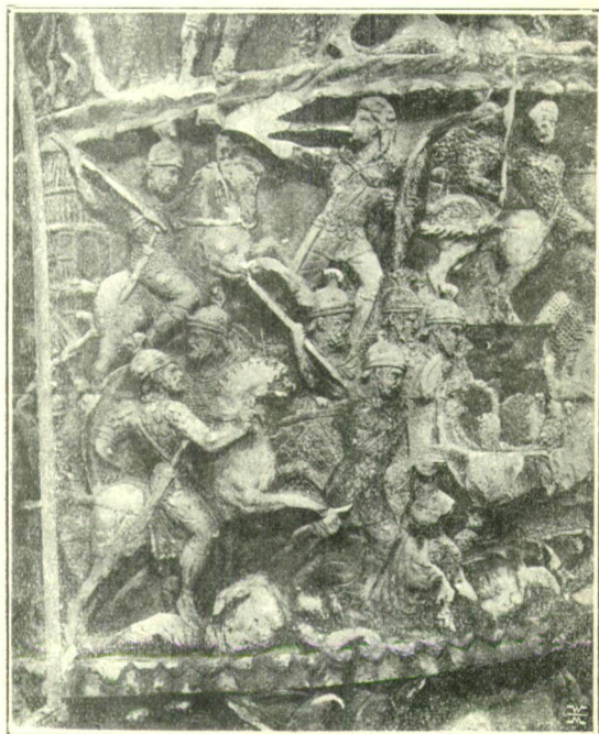
26. sz. Egy tiszántúli sármata falu elpusztíttatása. 1

császártól s nyertek is, de egyebek közt azzal a kikötéssel, hogy a jazyg-okkal és markomannokkal minden összeköttetést megszakítsanak. Nemsokára az utóbbiakkal is egyezségekre lépett a császár.