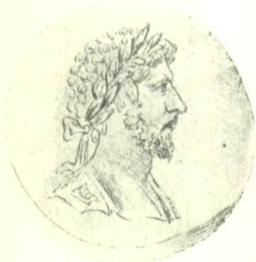
25. sz. Markus Aurelius császár. 2

be-becsaptak a gazdag tartományokba s ott iszonyú fosztogatást követtek el. Hadriánus már az orsovai nagy kő-híd felső részét is lebontatá, hogy makacs ellenfelei azon át Moesiába ne törhessenek. Végre valahogy békére lépett velök, a | K. u. 137-ben zászlói alatt szolgáló jász segédcsapat zsoldját felemelte, sőt a jászoknak, a Trajánus császár által visszatartott alsó-tiszai földrészt is visszaadta. 1