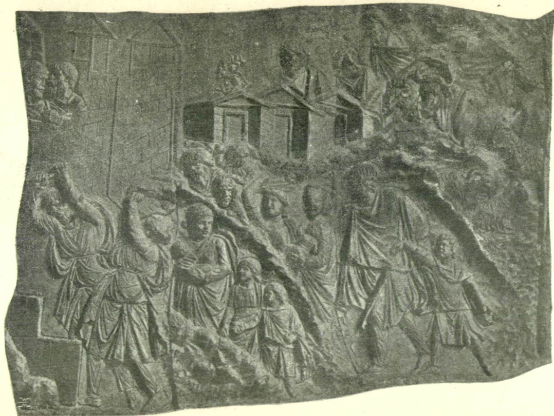
22. sz. A dákok előkerülése családjaikkal s barmaikkal legyőzetésük után.

(A Traján-oszlopnak dr. Szombathy Ignác tulajdonában levő képeiről.)