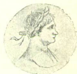
21 sz. Trajanus császár. 1

A fővárosban a diadalmas császárnak nagyszerű győzelmi ünnepély rendeztetett s annak emlékére egy egész diadalmi tér (Forum Trajanum) állíttatott az építészet és szobrászat legremekőbb műveiből, melyek közt különösen emlékezetes a Trajánus oszlopa, fehér márványból készült fölséges mű, melynek oldalán a nagy háboru jelei 118 dombor képben bámulatos művészettel örökítették meg, mely ábrázolatok még ma is megható bizonyosságot tesznek a küzdelem és erőfeszítések nagyságáról s a küzdő felek tekintetéről és elszántságáról. 2