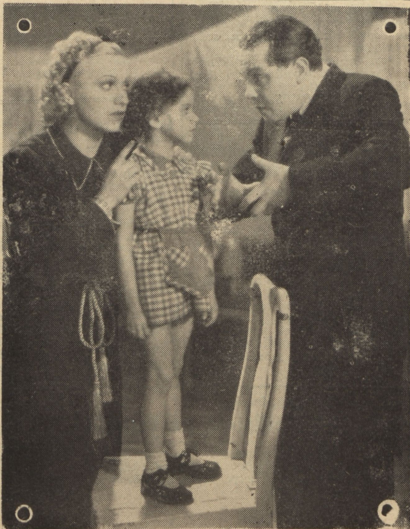
Jelenet a „Családi pótlék” c. filmből