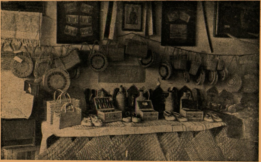
Csuhé kiállítás. Alsópáhok