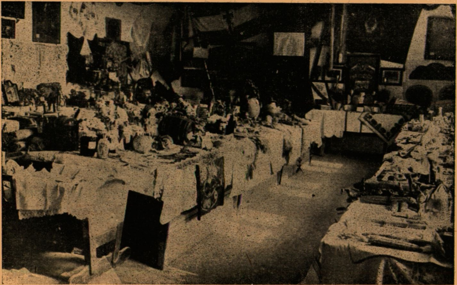
Alsópáhoki mezőgazdasági, háziipari, gyümölcs-kiállítás, előtérben a régi bő!cső