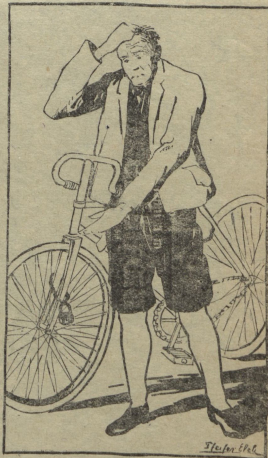
Hej nadrágom nadrágom ...