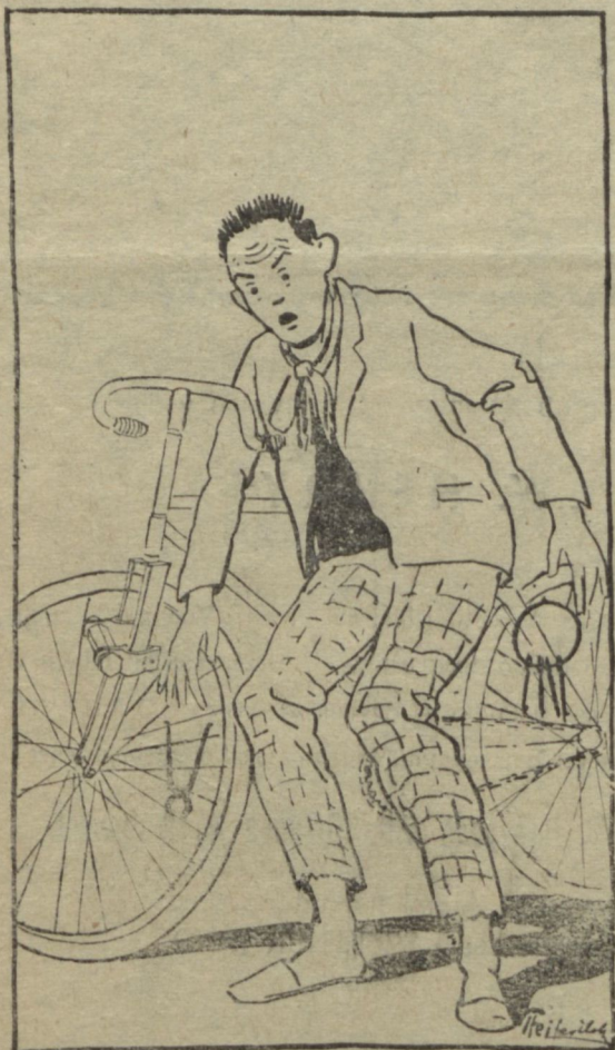
Mit szól a mama estére

— Nagy forgalom a loverseny fogadó irodában. Az egyik pechjéről ismert szegedi fogadó konzorciumot hozott össze egy nagyszabású fogadásra és 3 pengő tőkével lefogadta a „nem nyerek én soha“ nevű lovat. A fogadás majdnem sikerült.