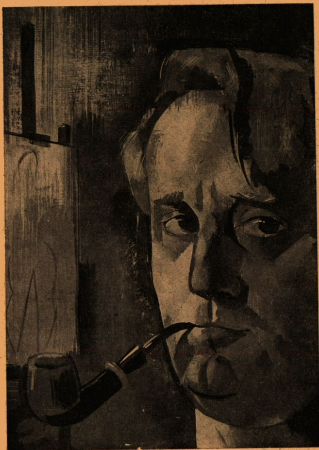
Aba-Novák Vilmos: Önarckép