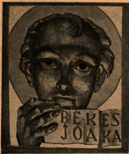
Angyalfej (részlet). A városmajori templomban