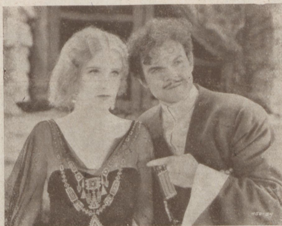
CATHERINA DALE OWEN és LAWRENCE TIBBET SASOK ÉNEKE (Métro hangosfilm)