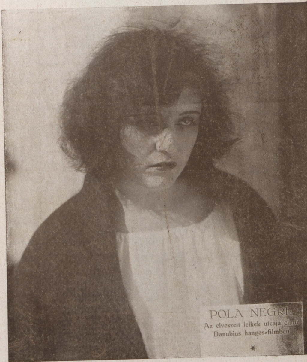
POLA NEGRI Az elveszett lelkek utcája című Danubius hangos-filmben