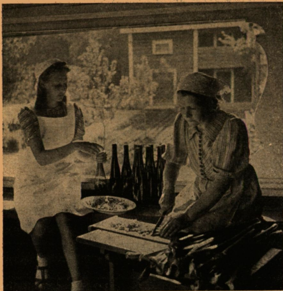
A lábadozó katonák számára friss rebarbara-must készül

A be'ső vándorforgalom főleg Viipuri felé irányult, a dal, a tánc, a derű városa felé. A búskomor hangulatokat ébresztő kopár északi halmok, az ingoványos orosz határvidék lakói az olcsó körutazási jegyekkel a fehér éjszakák évszakában Karja'la felé vették útjukat, hogy erőt és fényt szívjanak magukba. Nemcsak sűrű vonatjáratok,