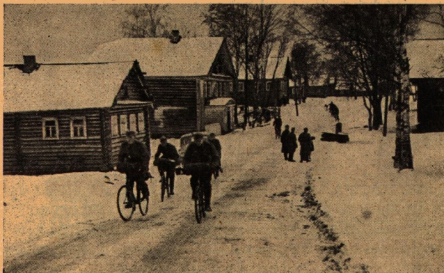
Felszabadult kelet-karjalai falu