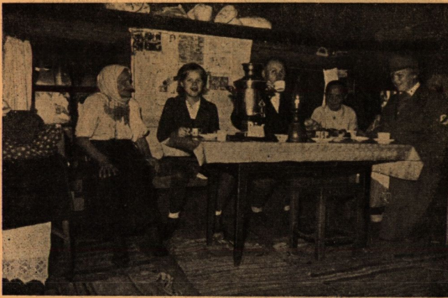
A finn női hadsereg tagja betér a parasztokhoz egy csésze kávéra