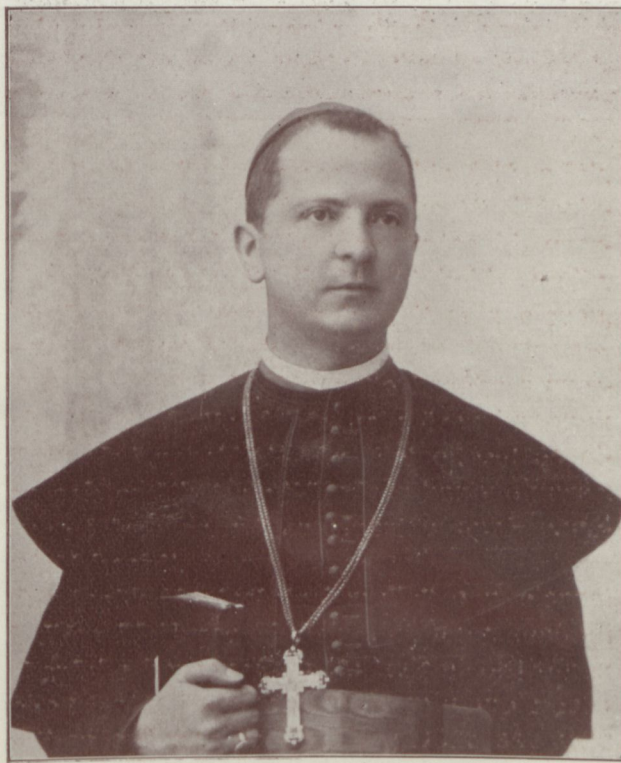
GRÓF MAJLÁTH GUSZTÁV KÁROLY erdélyi püspök arcképe 1908-ból

A pályaválasztás nem képezte élénkebb vita tárgyát. Hallgatólagos megegyezéssel a család minden tagjában ott élt a gondolat mindig, hogy Gusztáv pap lesz. Mint minden diáknak, úgy Majláth Gusztávnak is volt kedvenc tantárgya. Még pedig: a latin klasszikusok. Ezeket szerette s boldog volt, ha elmerülhetett azoknak a világában. Az erdélyi püspök gyönyörű latinsággal ír és beszél ma is. Bár megállapodott gondolat volt Gusztáv papsága és ő maga sem ellenezte azt soha: mégis választ az érettségi alkalmával még nem adott. Az otthon nyert finom lelkineveléssel, a lelkében levő szelid, tiszta hajlamokkal, miknek minden mozdulatára szigorú szere-