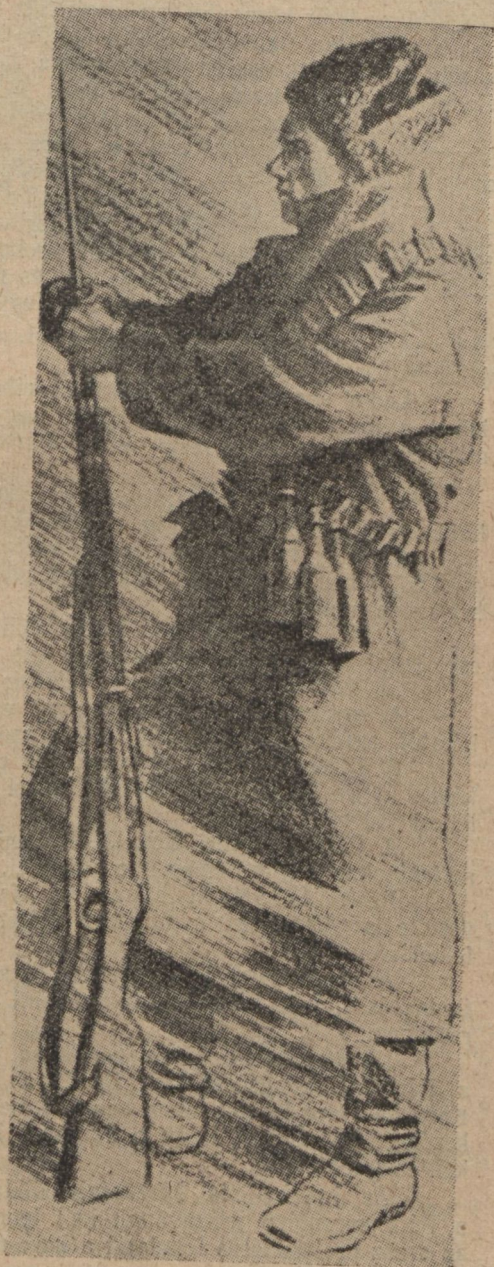
Vörösgárdista. N. M. Kocsergin rajza

A VI. pártgyűlés határozatai arra irányultak, hogy a proletariátust és a szegény parasztságot megszervezve, a fegyveres felkelésre előkészítsék. A Pártgyűlés a Pártot a fegyveres felkelésre, a szocialista forradalomra irányította.