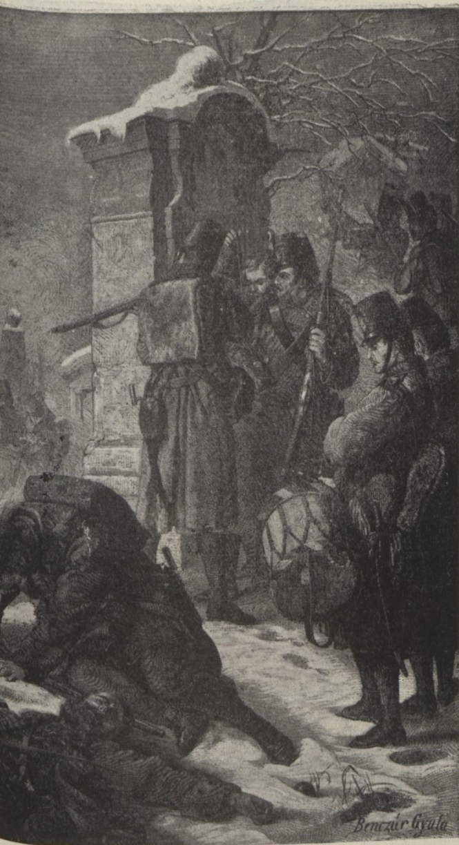
A temetői csata.