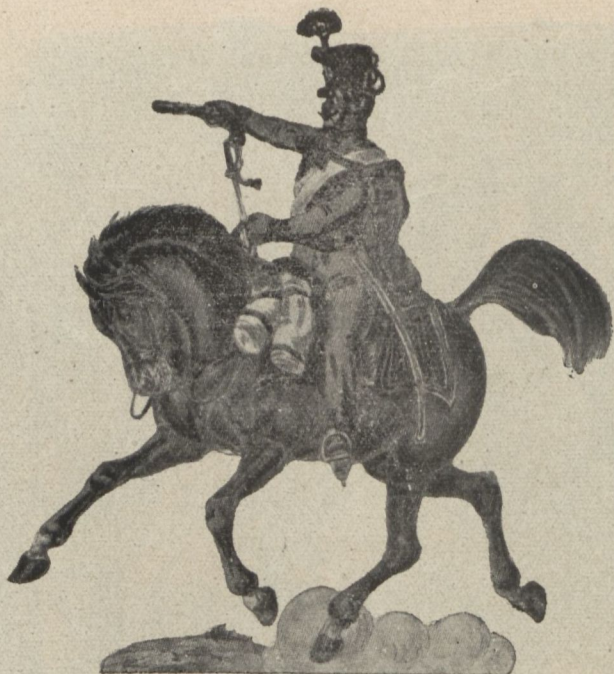
2. ezredbeli huszár

A magyar ezredek — főként huszáraink — az áldozatos hazaszeretet felemelő példáját mutatták. A sorgyalogzászlóalj 48-as honvédségünk megszervezésénél követendő mintául szol-