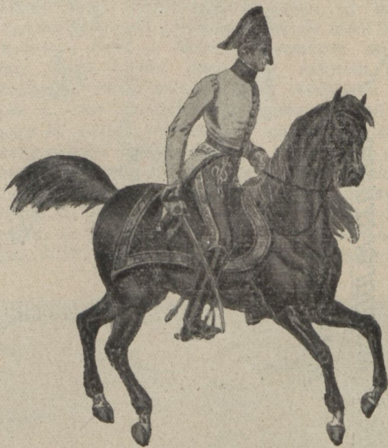
1848 előtti osztrák törzstiszt

A nép fiai megtették kötelességüket. Nemcsak a lélekemelő hősiességnek és szabadságszeretnek emeltek oltárt, hanem tiszteletet és megbecsülést szereztek maguknak, a magyarságnak és mai honvédtudódaiknak.