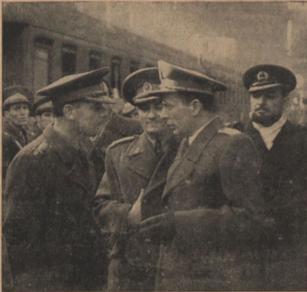
A magyar honvédség nevében a pályaudvaron Illy Gusztáv vezérőrnagy üdvözlí a román hadsereg népi enek- és tancegyüttesét.

A brit polgári repülésügyi minisztérium közli, hogy február 4-én ejjjel az északi Atlanti-tenger fölött kísérleti repülést végzett egy olyan gép, amely az üzemanyagot levegőben kapja. Montreal és London között a légi út 13 óra volt. Az üzemanyagfeltöltés 9000 láb magasságban történt Ujfundland felett. (Brit tájékoztató szolgálat.)