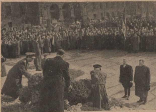
Veres Péter honvédelmi miniszter a honvédség, Nógrádi Sándor államtitkár a Magyar Szabadságharcos Szövetség nevében koszorút helyez a Kossuth-szoborra.

Tildy Zoltán köztársasági elnök beszédében többek között megállapította: