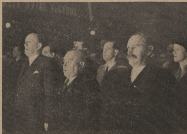
Dinnyés Lajos miniszterelnök, Rákosi Mátyás miniszterelnökhelyettes és Veres Péter honvédelmi miniszter a Magyar Szabadságharcos Szövetség alakuló nagygyűlésén.

A debreceni honvédszenekar átérezve a tiszai árvíz-károsultak súlyos helyzetét, felajánlotta azt is, hogy egy többgyermekes család házának újjáépítéséhez szükséges 8000 forintot előteremtí. Az összeget három hangverseny rendezésével fogja a zenekar megszerezni.