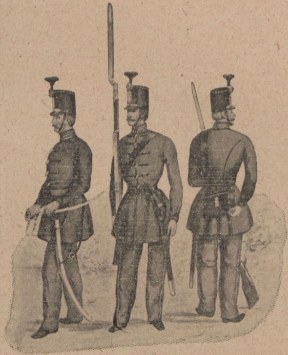
Honvéd gyalogság 1848-ban.

Még nagyobb a gyalogság jelentősége, ha a honvédseregben elfoglalt helyzetét vizs-gáljuk.