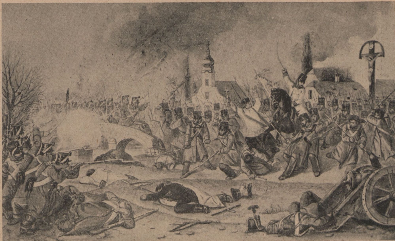
Kápolnai csata. Than Mór vízfestménye.

Az önkéntes szabadcsapatok jellege nemcsak az önkéntes mivoltukban volt, hanem hogy felállító parancsnokaik költségén fegyverezték fel őket és azok viselték fenntartásuk költségeit.